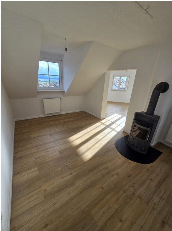
Esszimmer mit Kamin