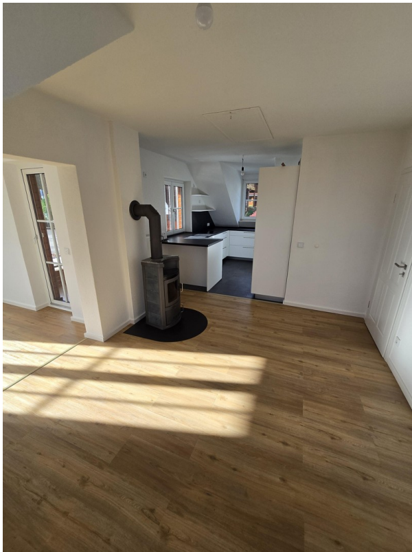
Esszimmer mit Kamin