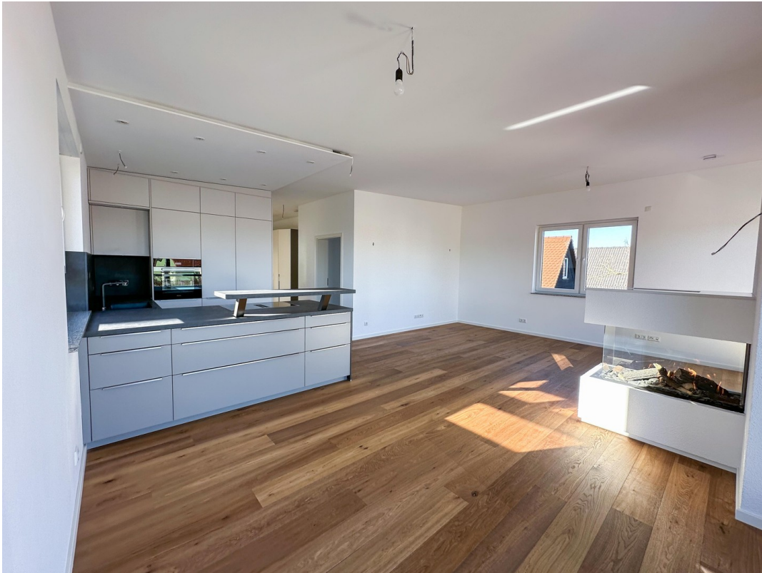
EBK - Essbereich- Kamin