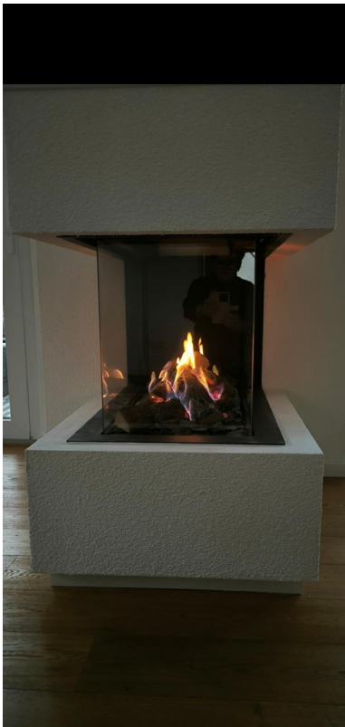
Gaskamin in Aktion