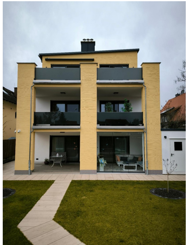
Rückansicht des Hauses