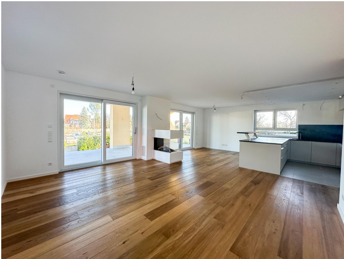
Übersicht von Wohnbereich