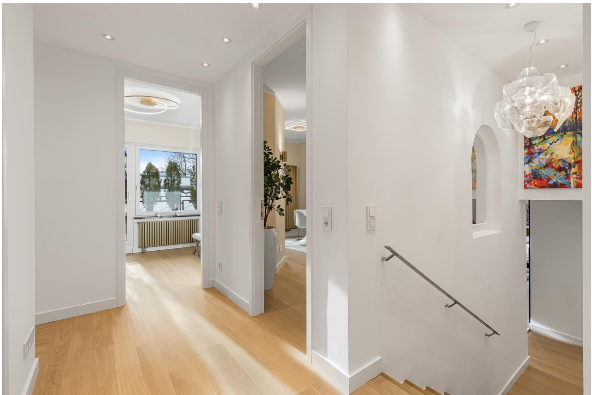
Flurbereich zum Schlaftrakt