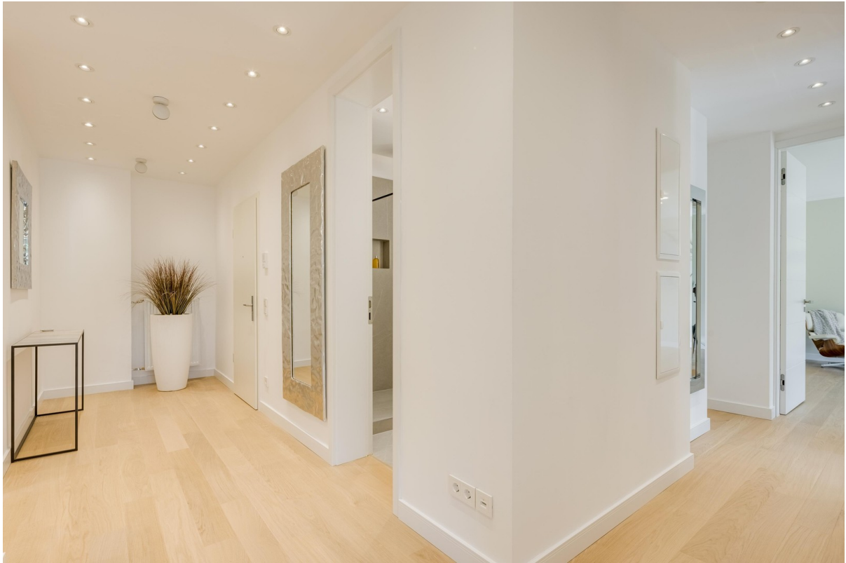
Eingangsbereich mit Garderobe