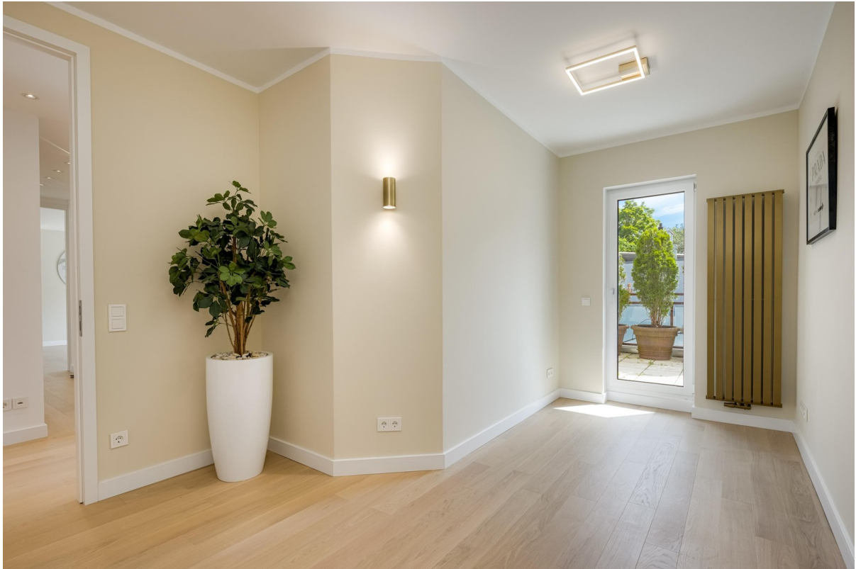
Gäste-SZ 2 Kinder/Bürozimmer