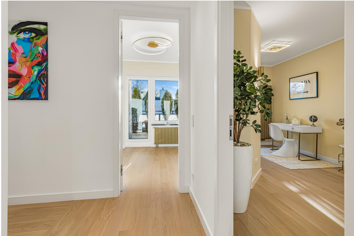
Zugang: Kinder / Bürozimmer