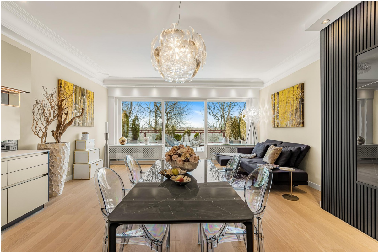
Ausblick vom Kamin