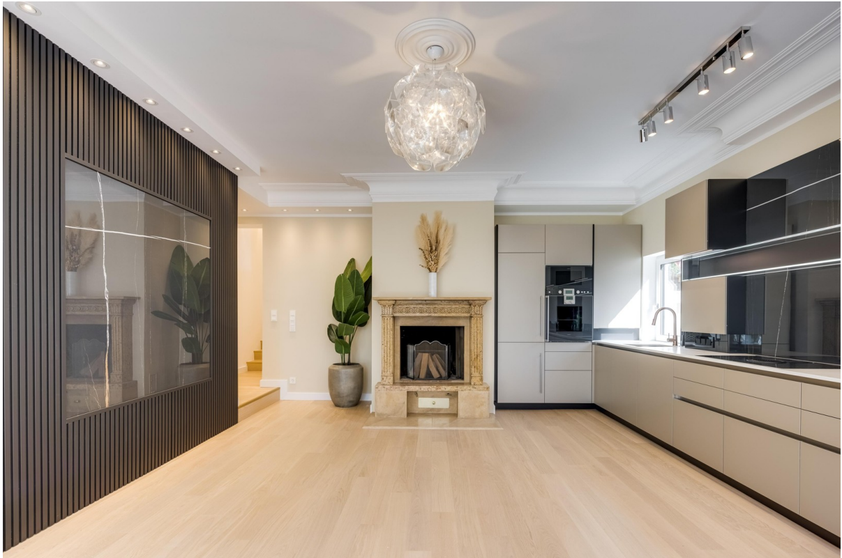
Space im Wohn- und Essbereich