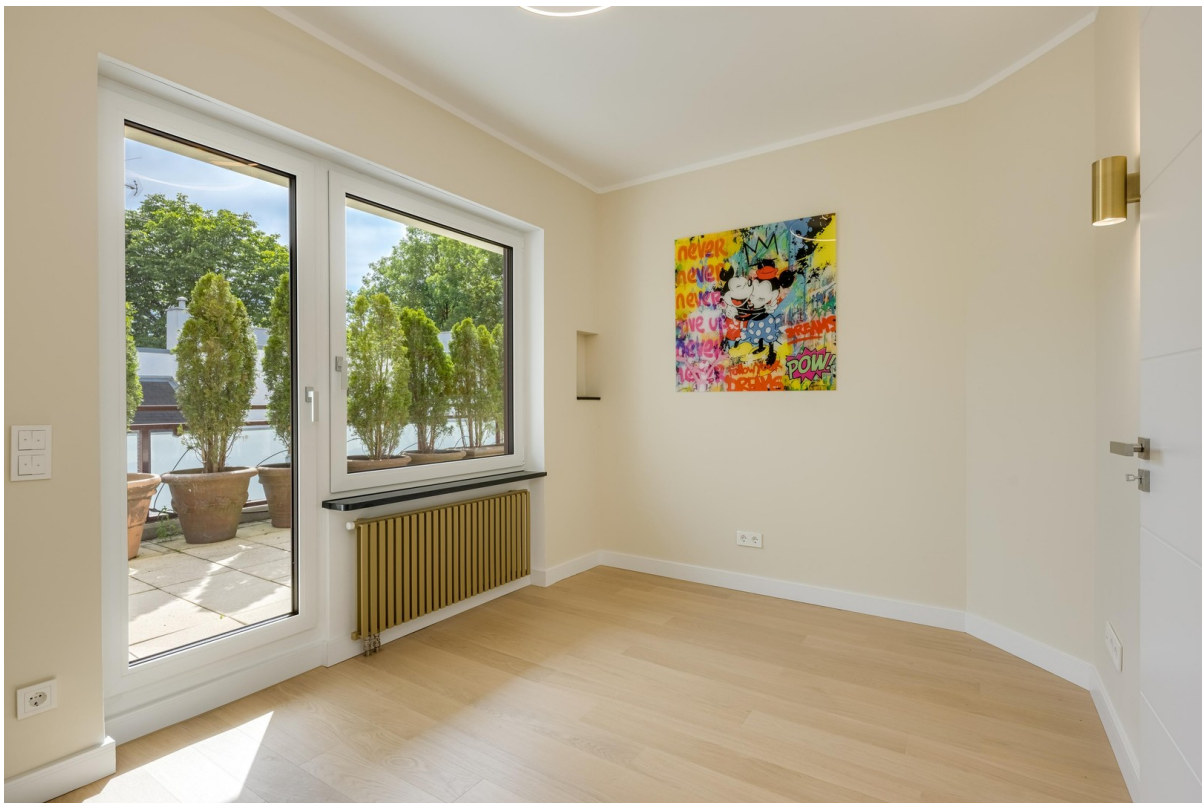
Gäste-SZ 1 Kinder/Bürozimmer