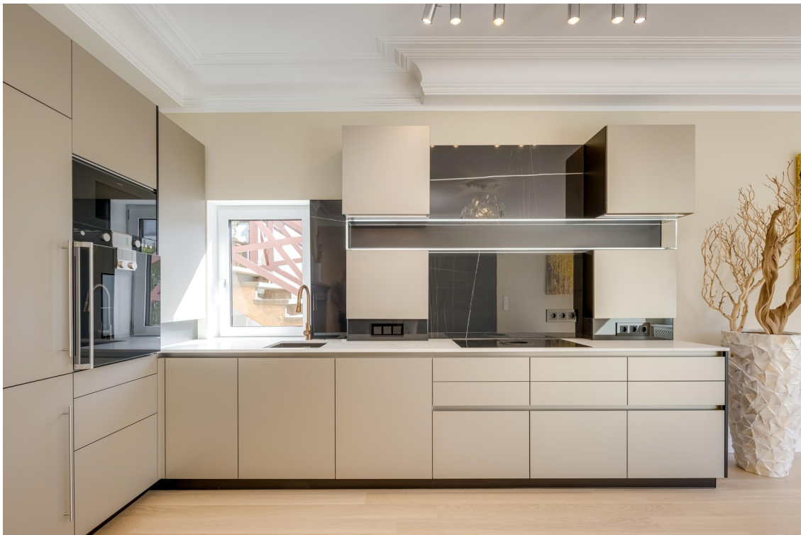
Küche in edlem Champagner