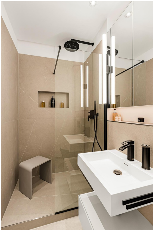
Shower im Duschbad