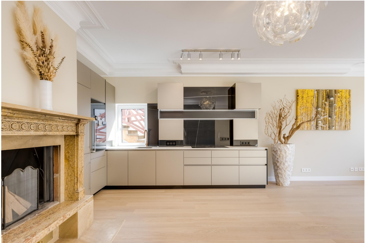
Schreiner-Einbauküche m. Kamin