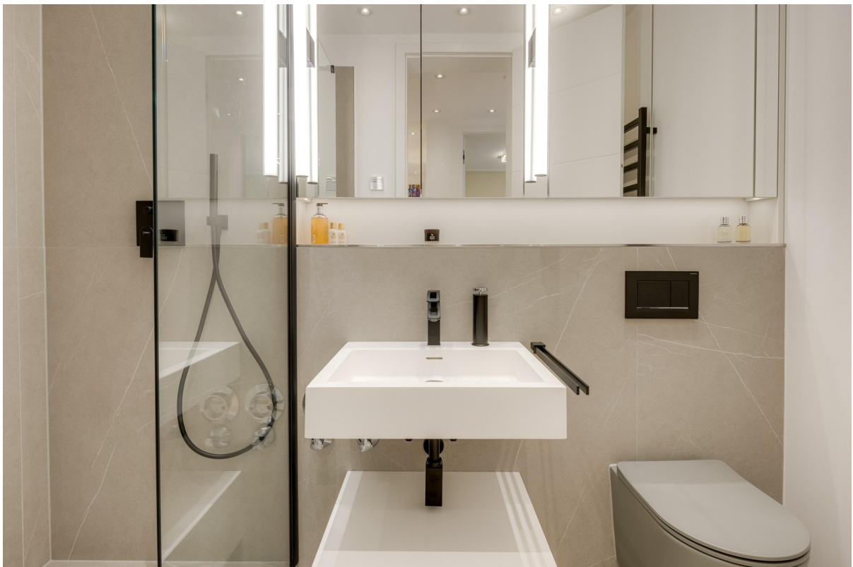
Gäste / Kinder-Duschbad