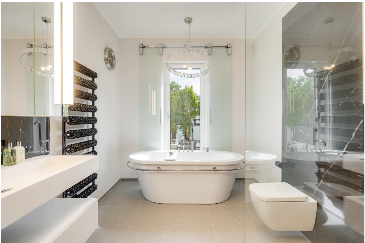
Masterbad - Wohlfühloase