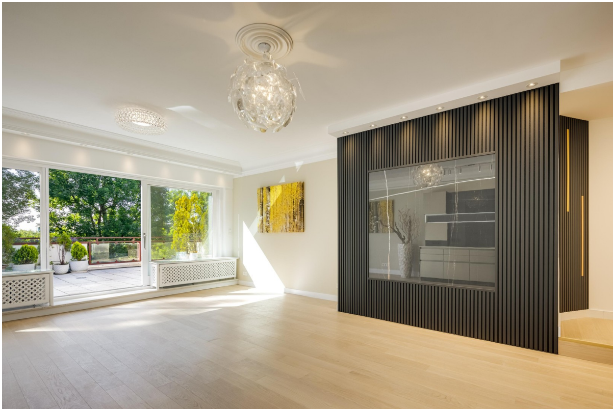
Viel Platz für eigene Ideen