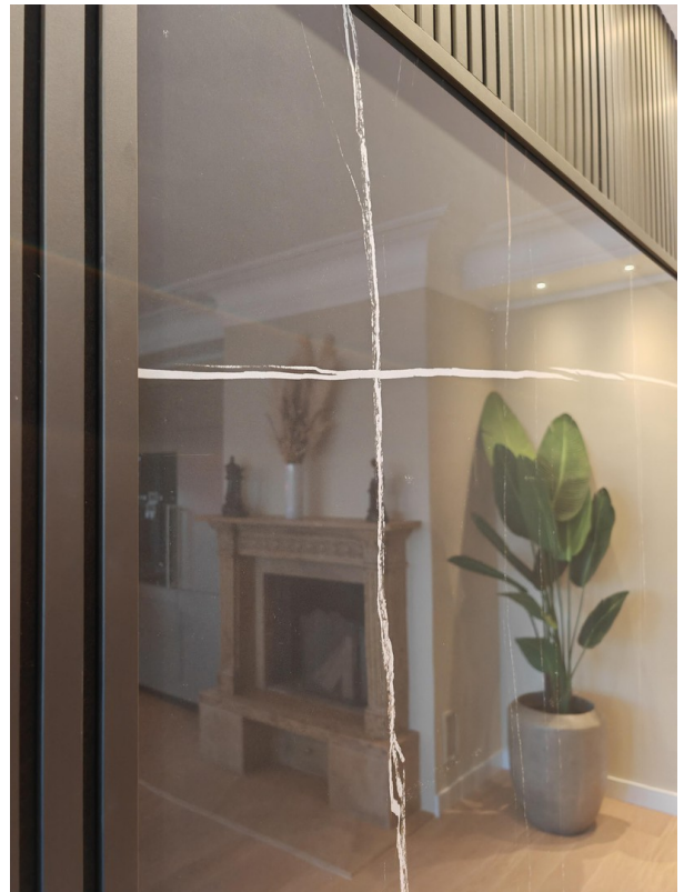
Ausgewählte Feinsteinz. Fliese