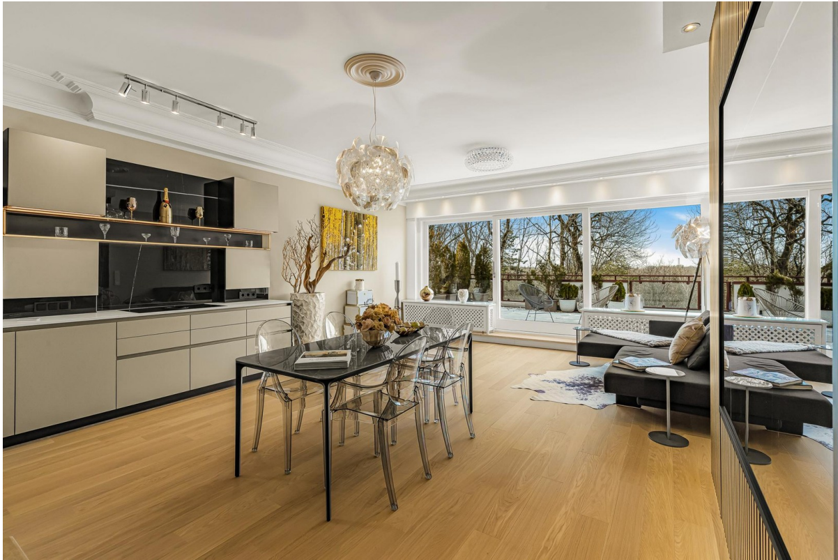
4-Zi.- Penthouse: Living-Essen