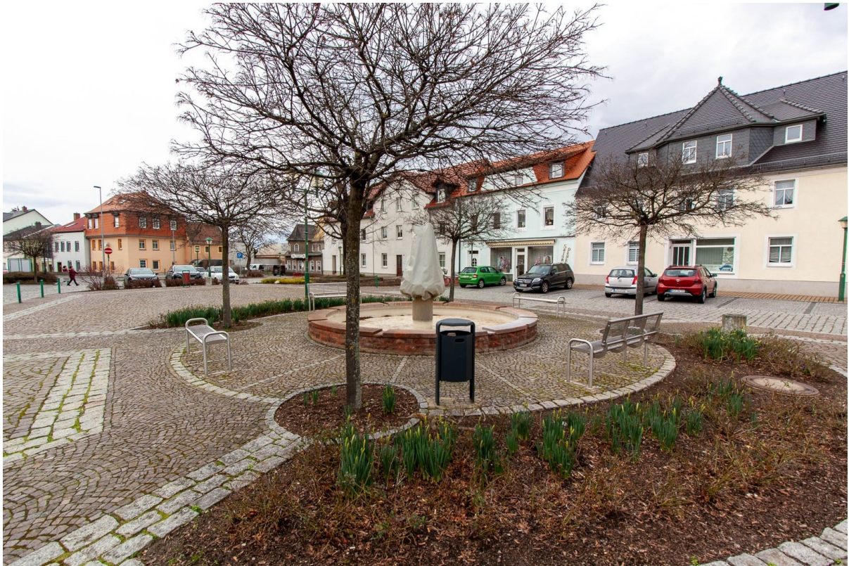
Stadt Bad Lausick