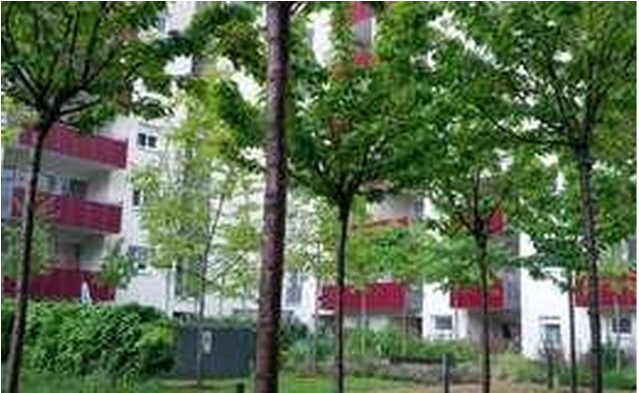
Innenhof mit Hauseingang