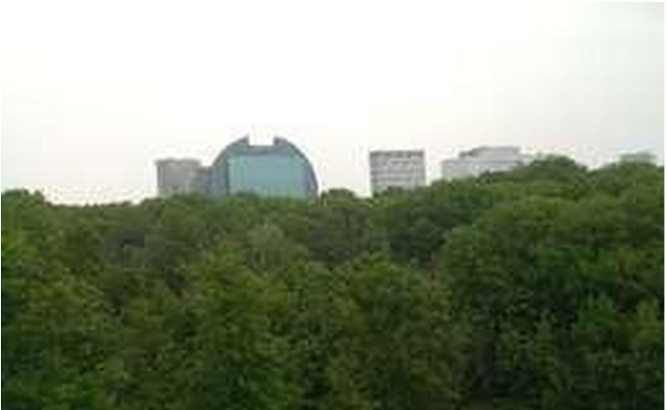
Blick von Schlafzimmer