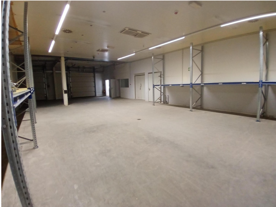
Innenansicht Halle 2