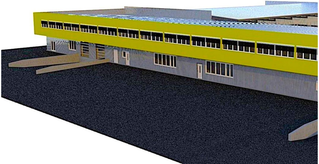
Vorderansicht mit Parkplatz