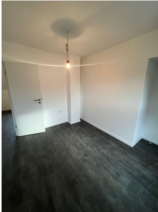
Zimmer 3 neben Zimmer 2