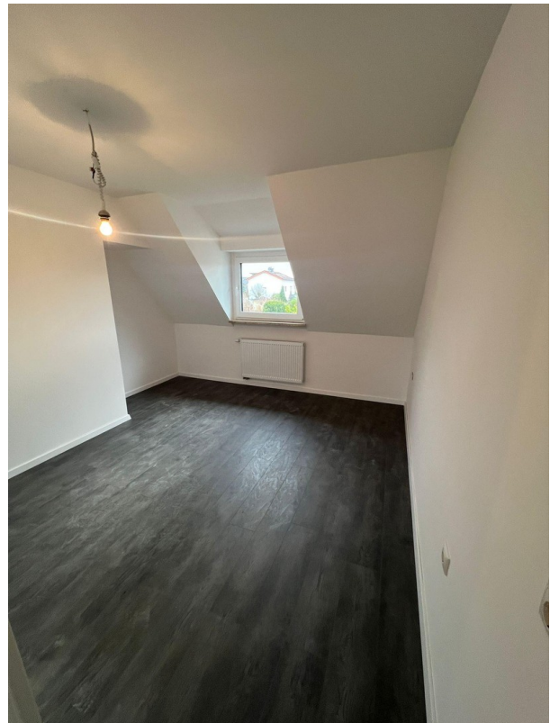
Zimmer 3 neben Zimmer 2