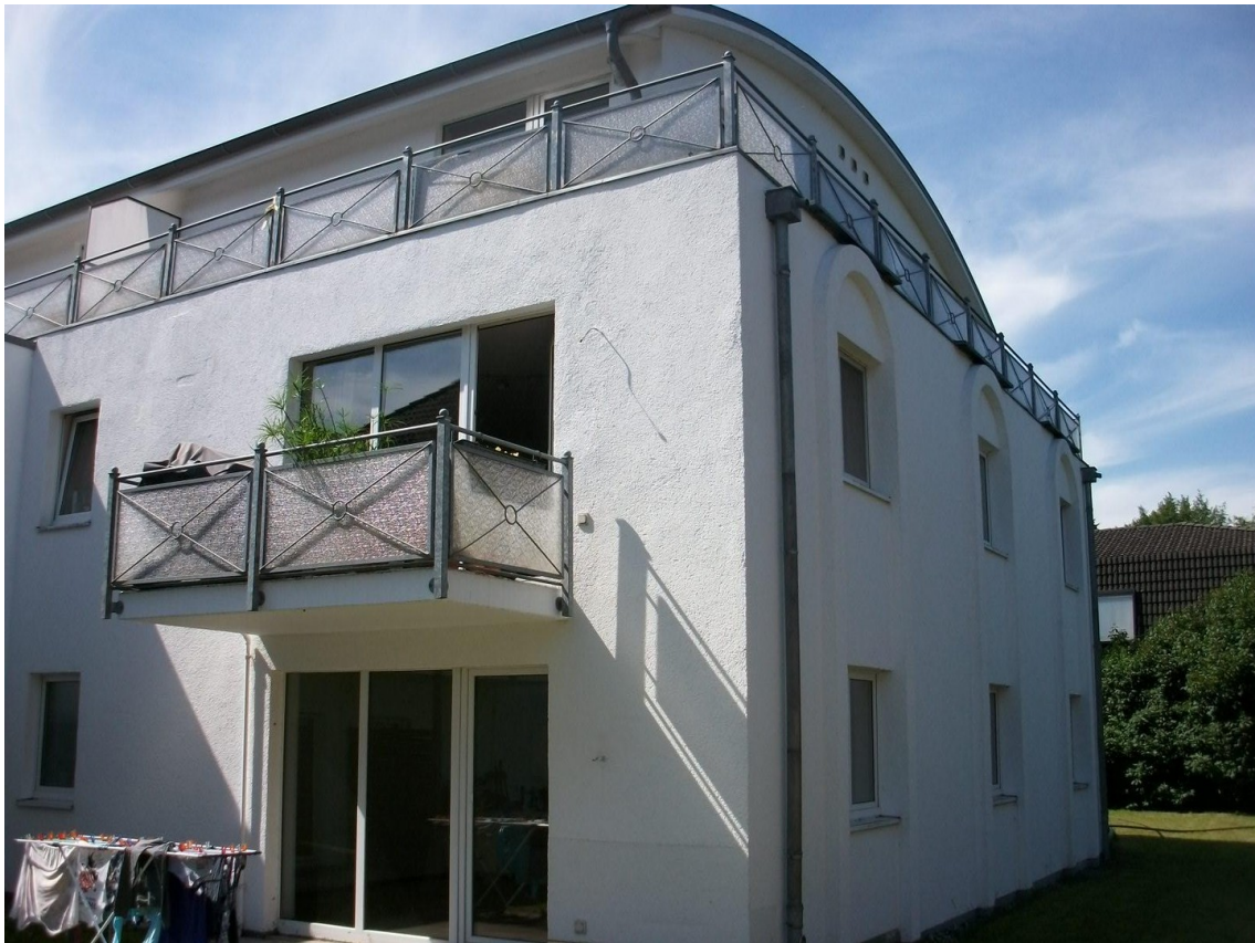
Lage der Wohnung zu Gärten