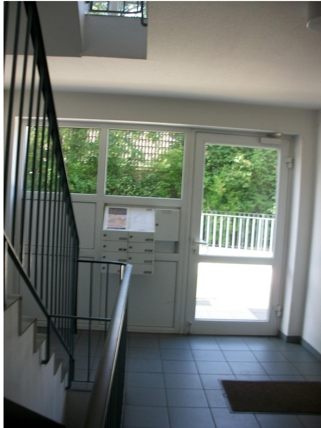
Hauseingang mit Treppenhaus