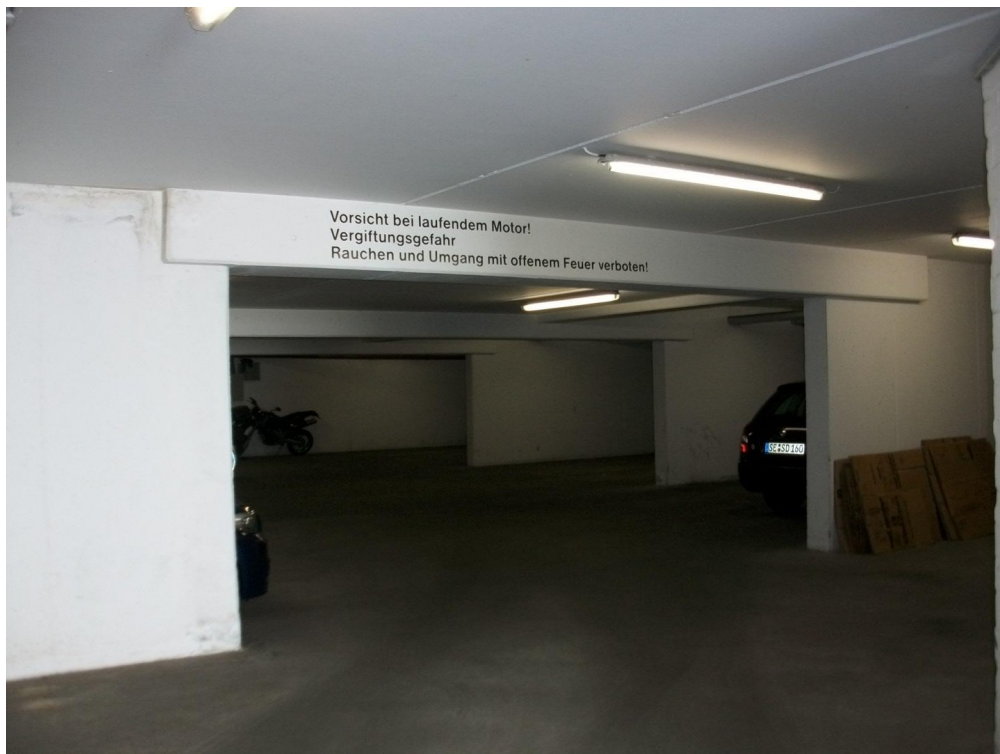
Tiefgarage im Haus