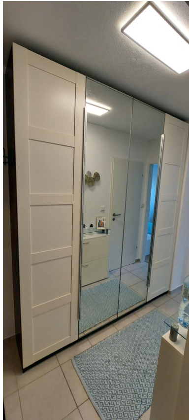
Schrank im Flur