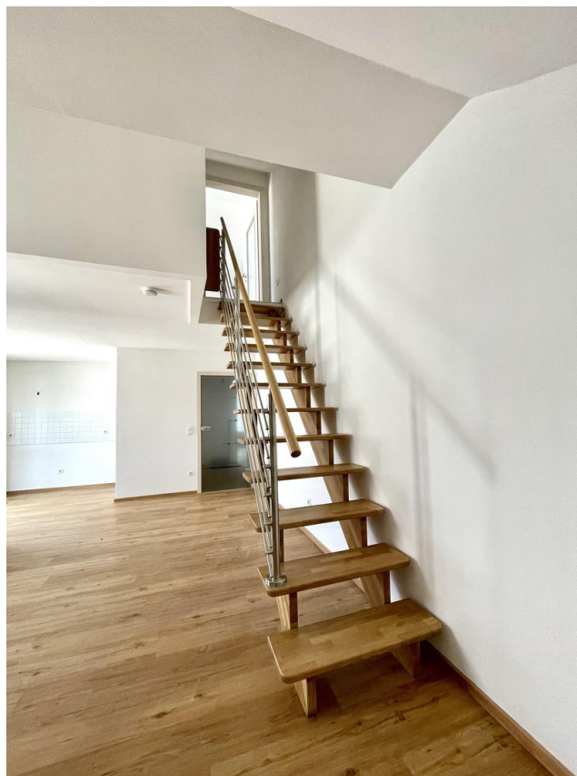
Treppe zur Galerie