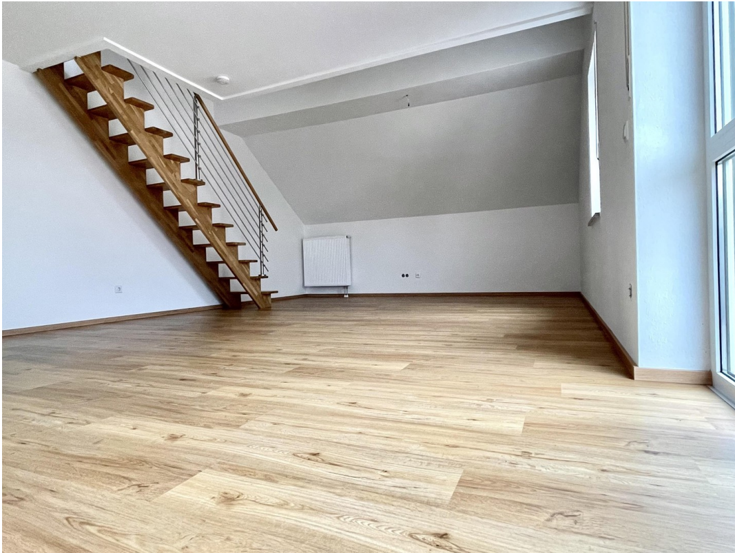
Ess- & Wohnzimmer