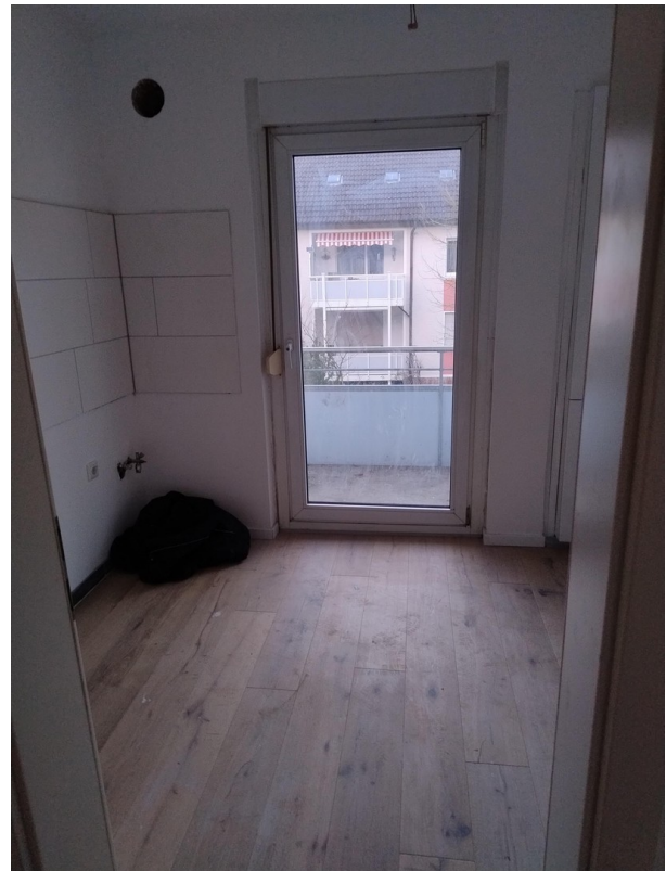
Küche mit Balkon