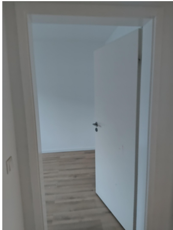
Eingang Zum Kinderzimmer