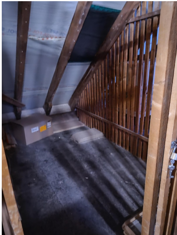
Abstellraum im Dachgeschoss