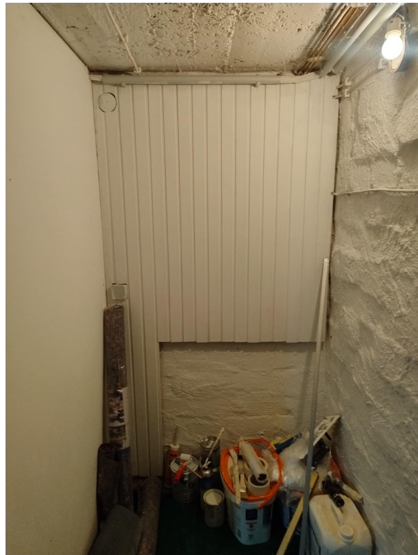
Vorraum im Keller