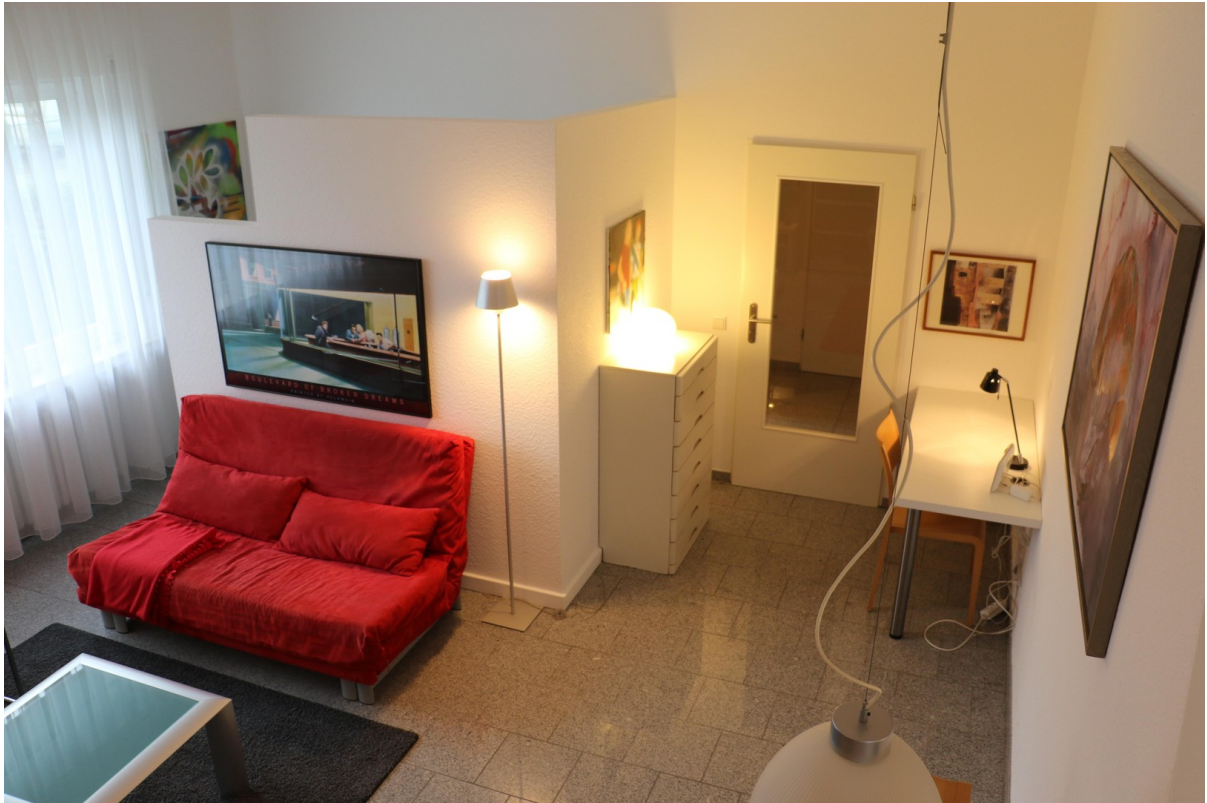
Wohnbereich mit Arbeitsbereich