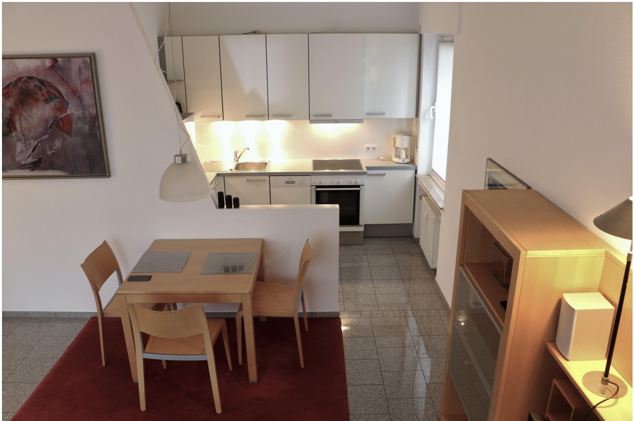
Essbereich und Küche