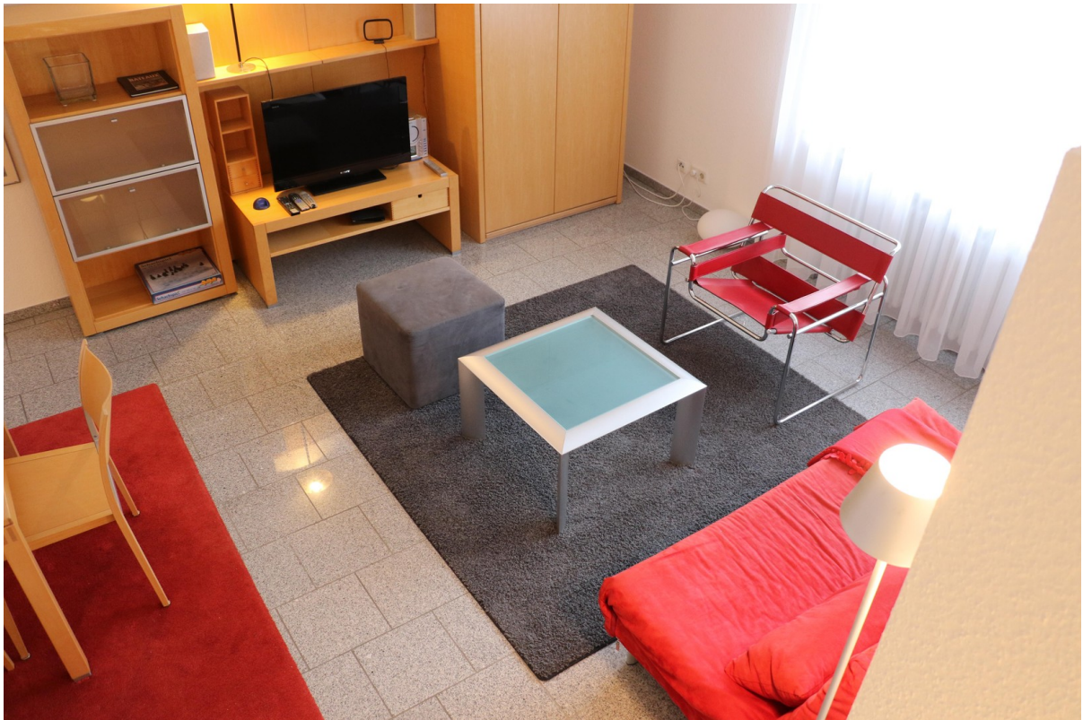
Wohnbereich mit Schlafcouch