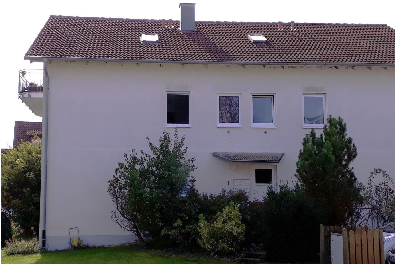
Bad Links, Blick vom Garten