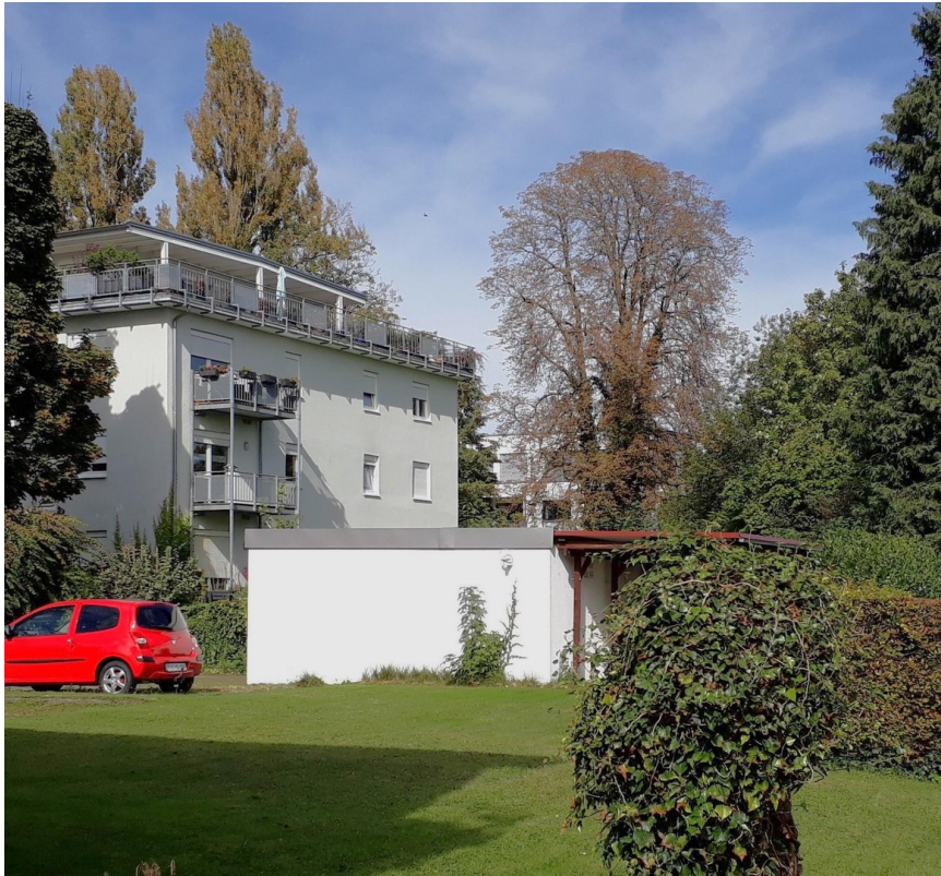
Blick im Garten zur Garage