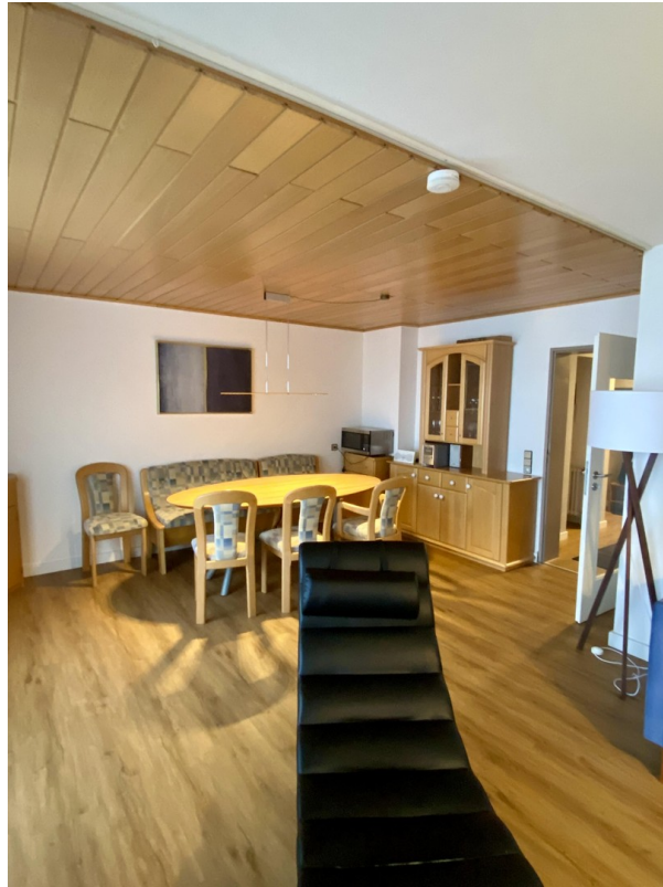
Essen - Sicht vom Wohnen