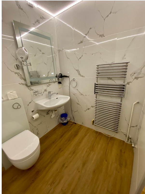
Badezimmer rechte Seite