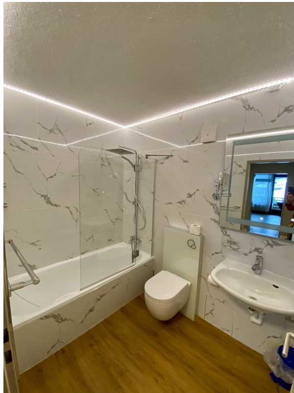
Badezimmer linke Seite