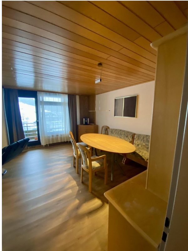
Essen - Sicht von der Tür