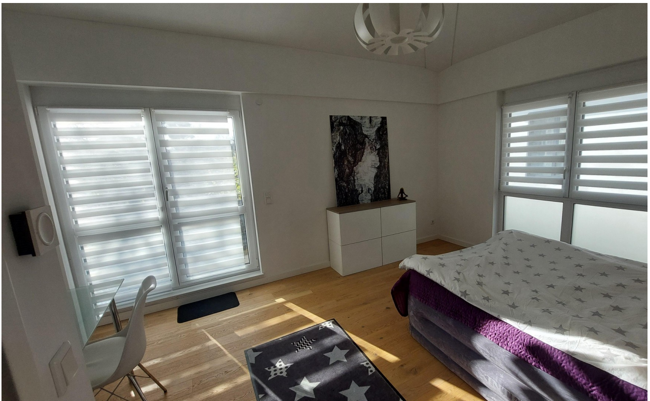
OG Schlafzimmer 3