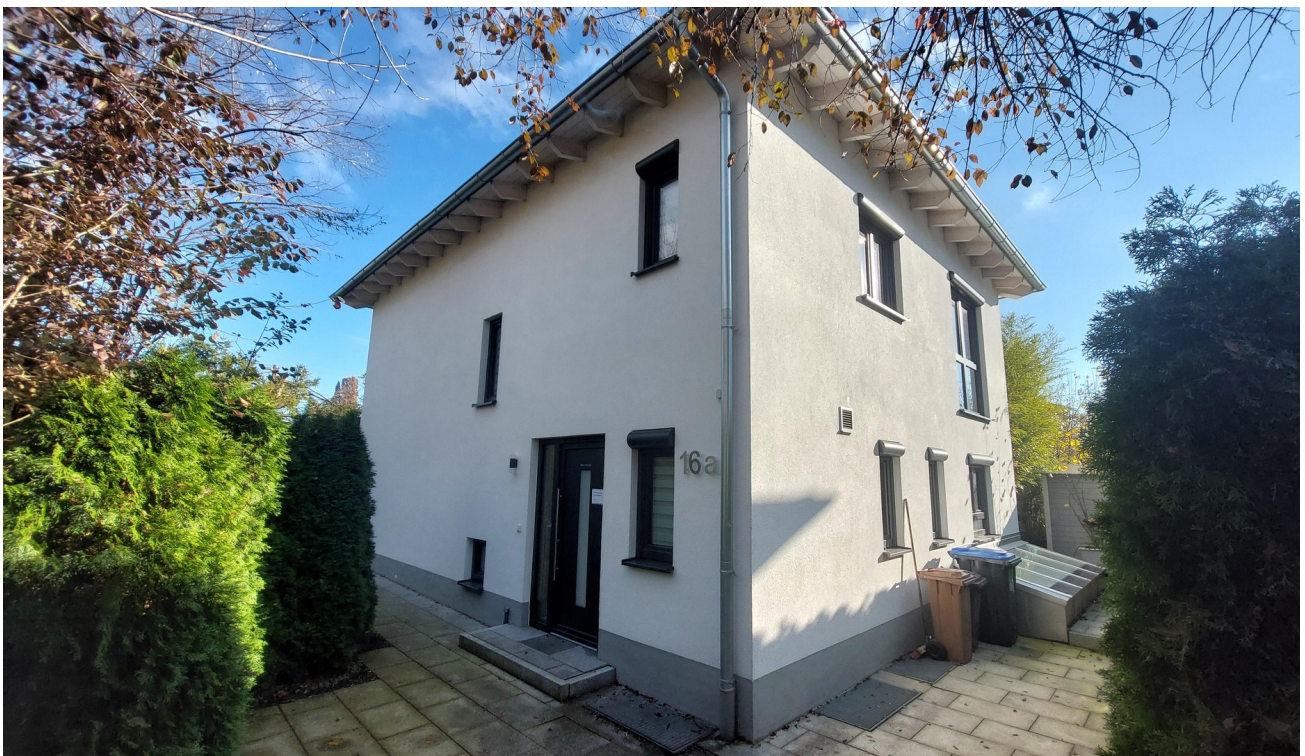
Außenansicht Norden Osten