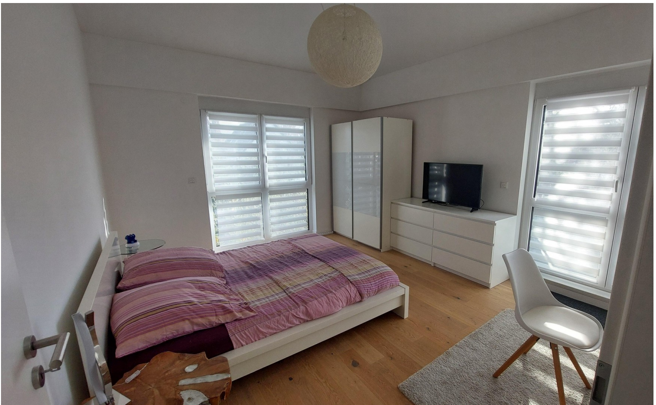
OG Schlafzimmer 1