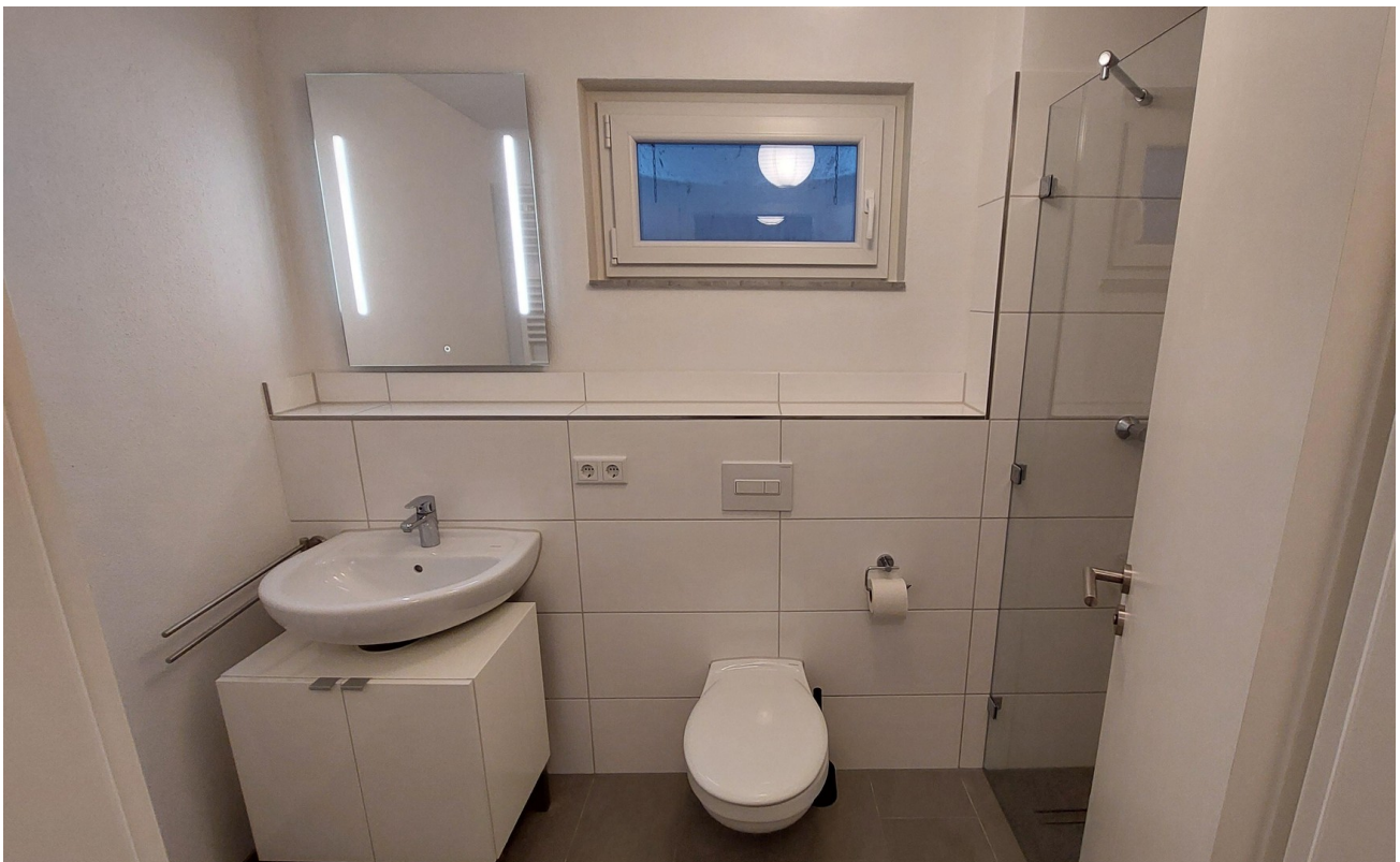
KG Bad 2 (mit Dusche groß)