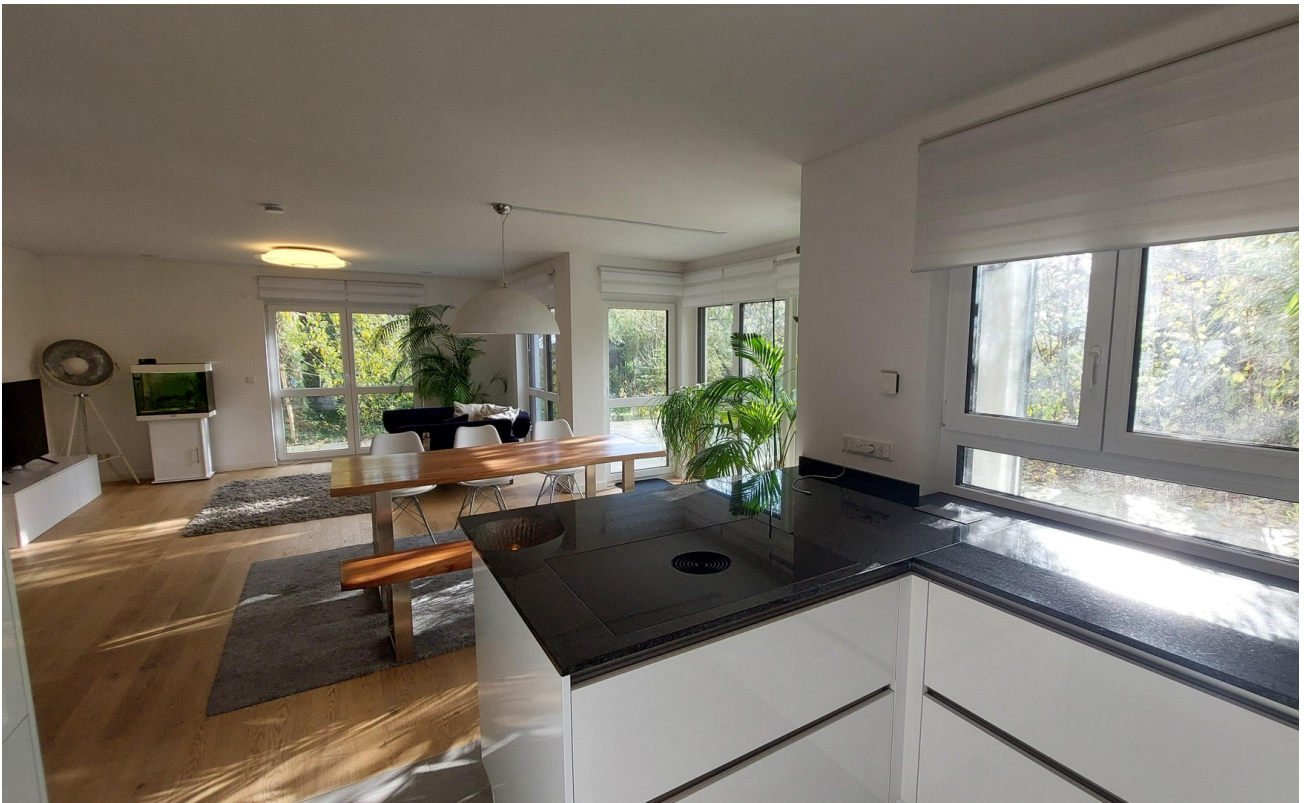
Wohnen, Essen, Küche