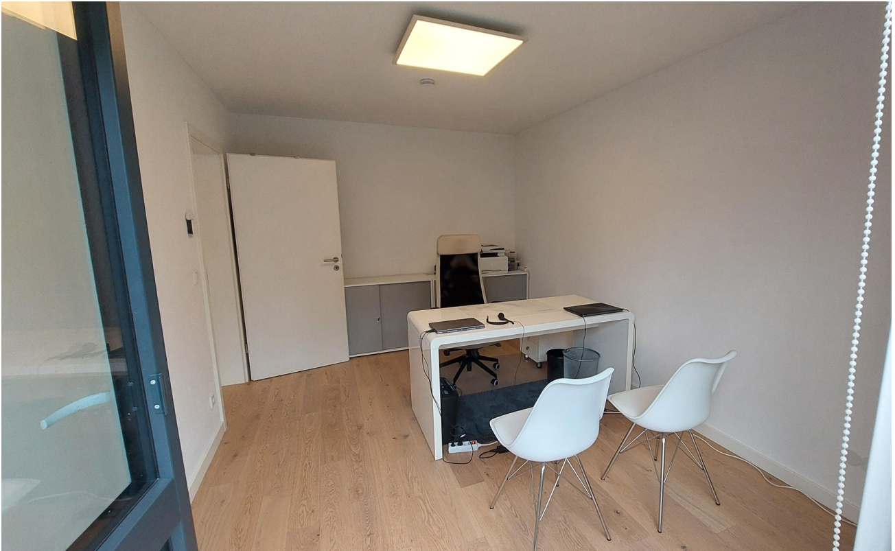
Zimmer EG (Schlafz. oder Büro)