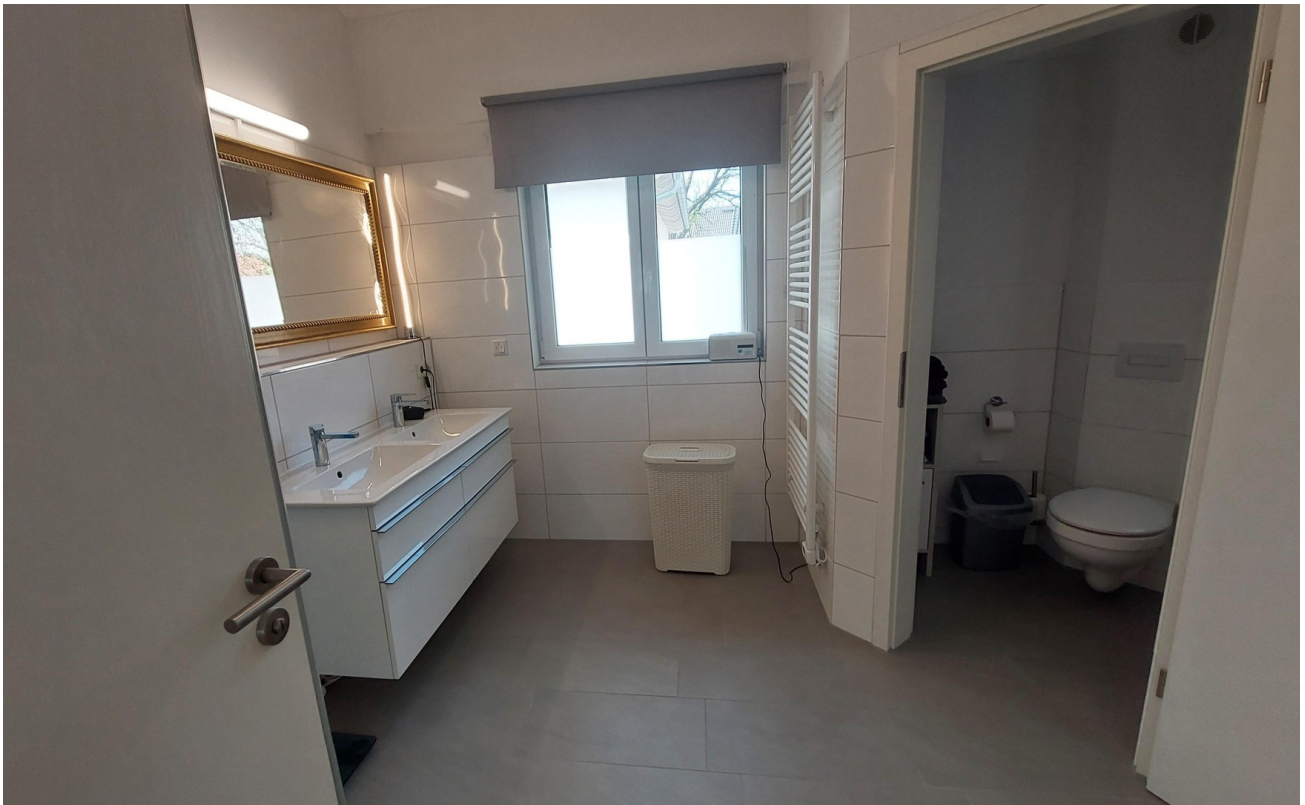
OG Bad mit abgetrenntem WC