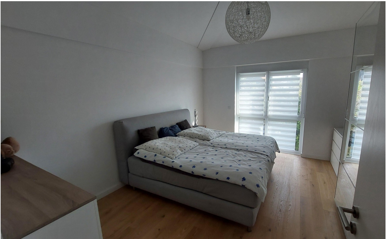
OG Schlafzimmer 2