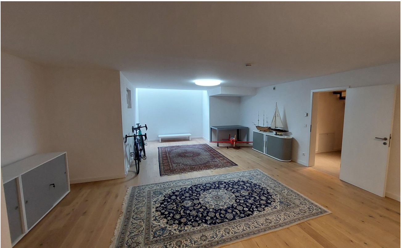
KG Hobbyraum mit Oberlicht