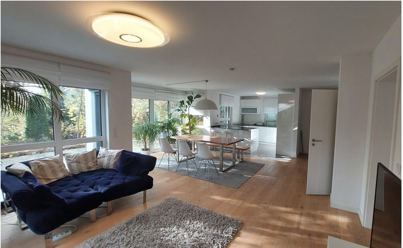
Wohnen, Essen, Küche