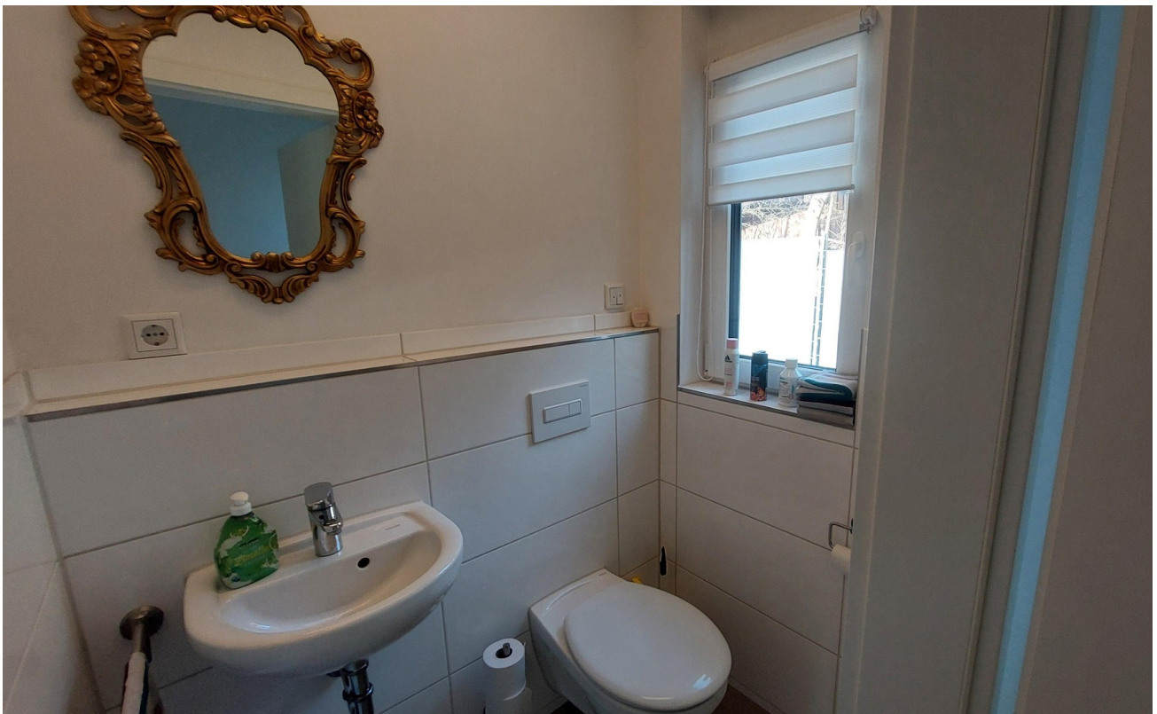
EG Gäste WC