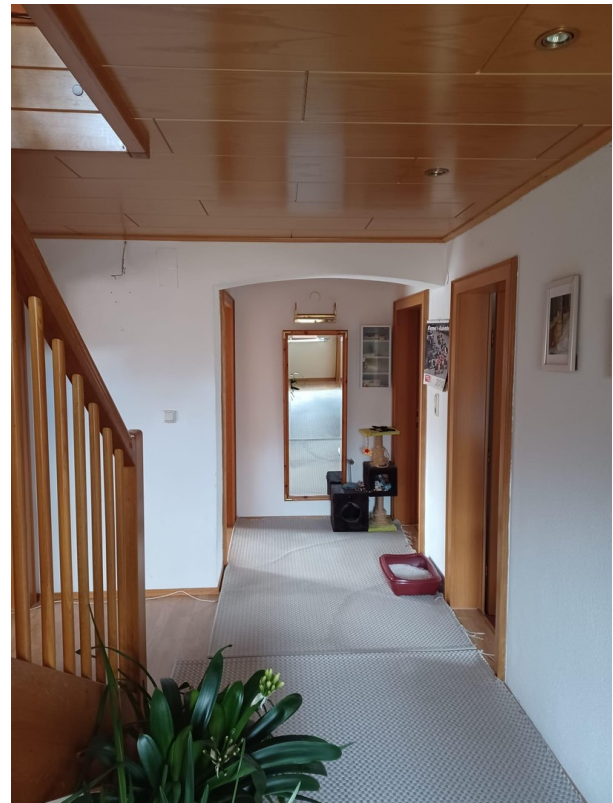
Hausgang 1. Stock