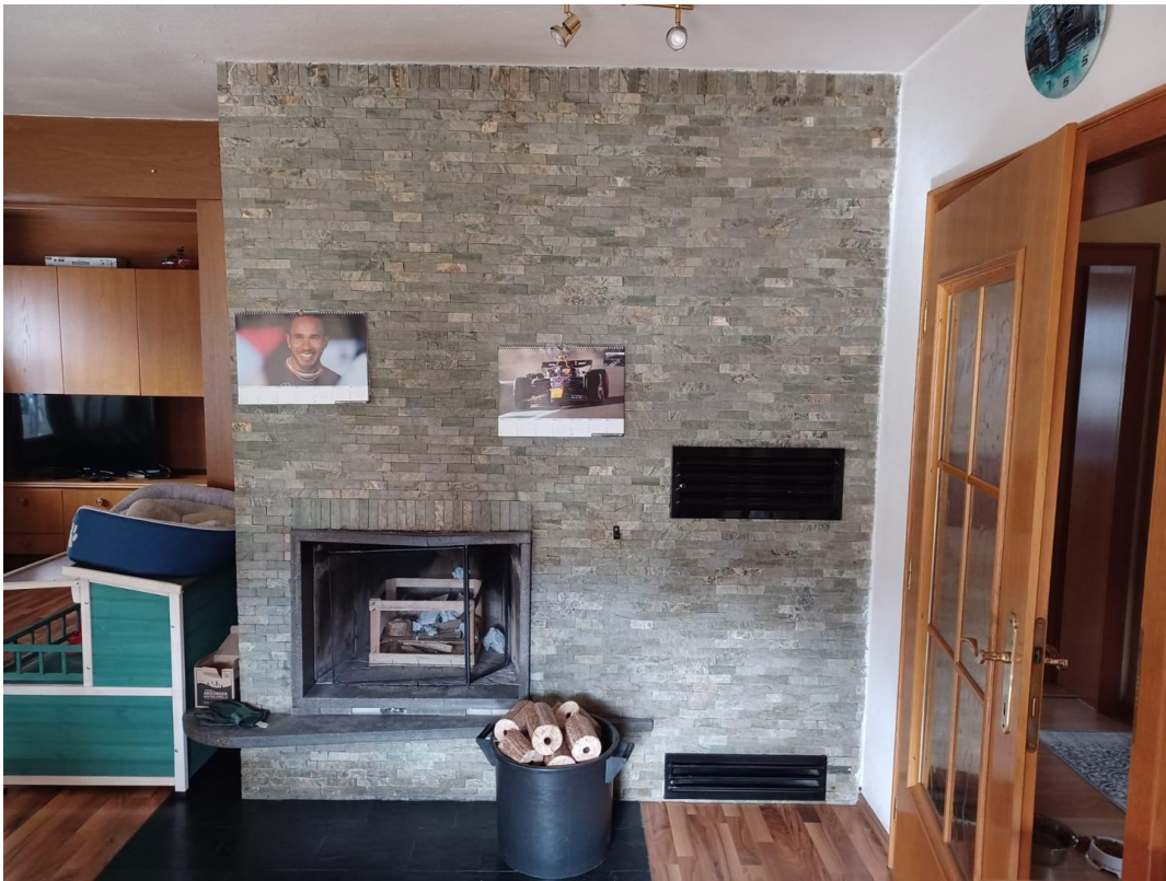
Offener Kamin im Wohnzimmer