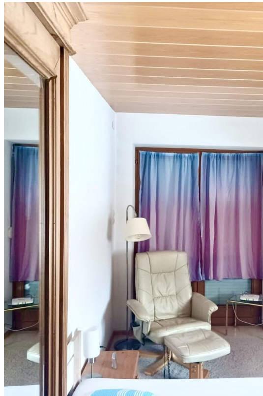
Zimmer 1. Stock