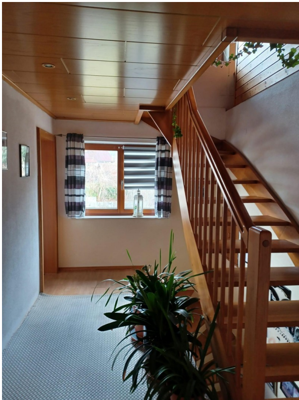
Hausgang 1. Stock