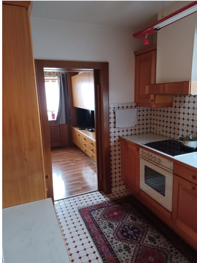
Durchgang Küche – Wohnzimmer