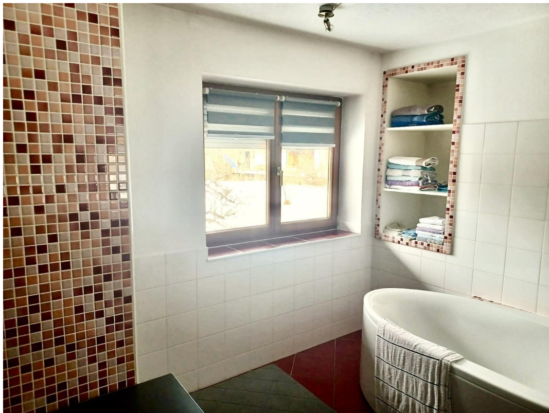
Bad mit Dusche und Whirlpool