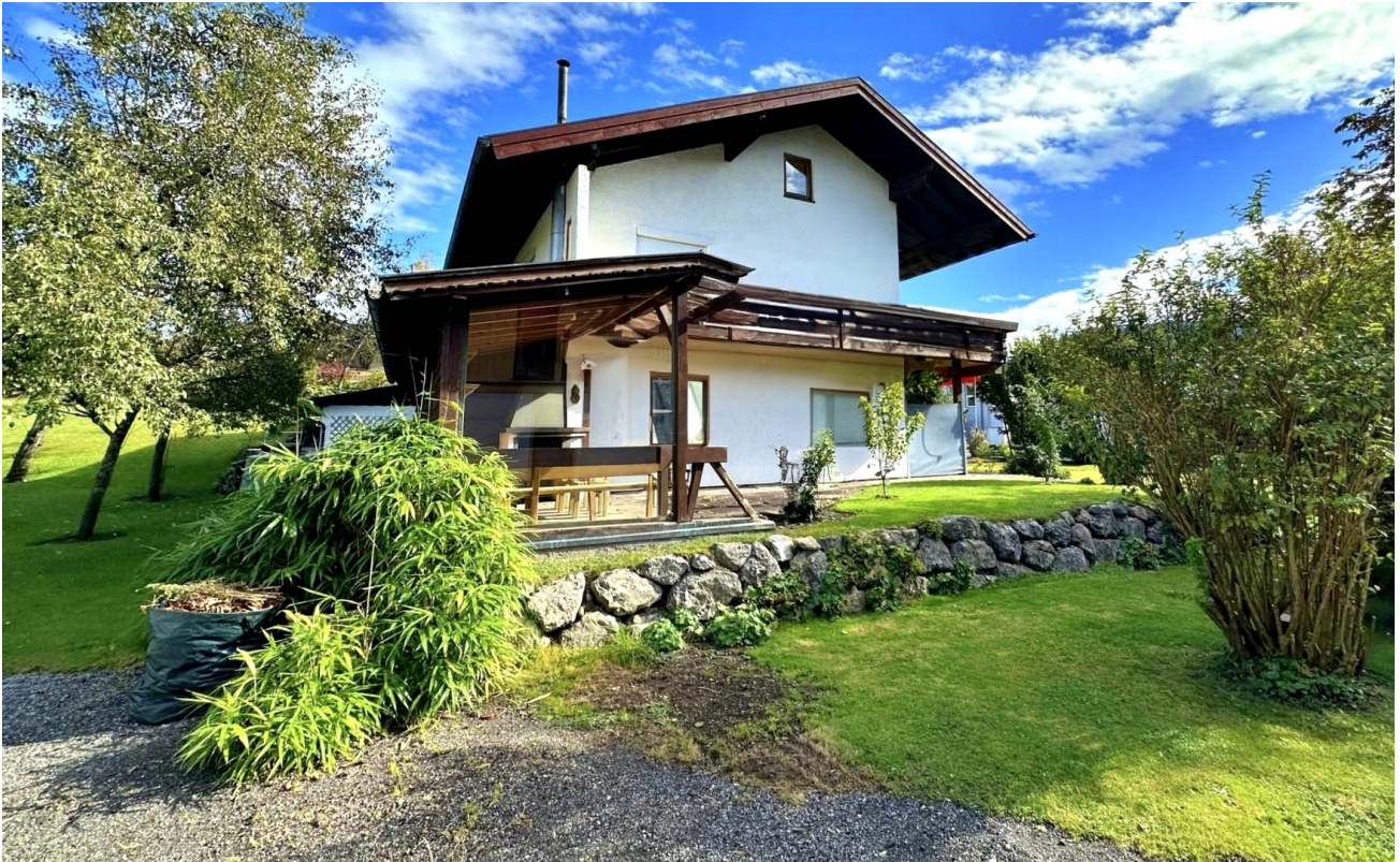
Außenansicht mit Pergola