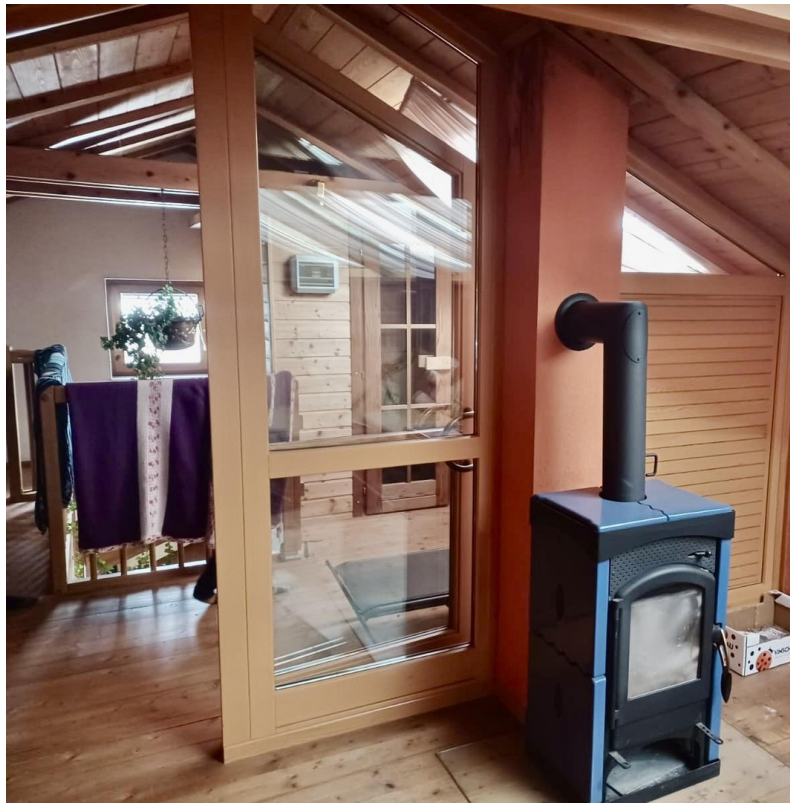
Dachboden mit Saun