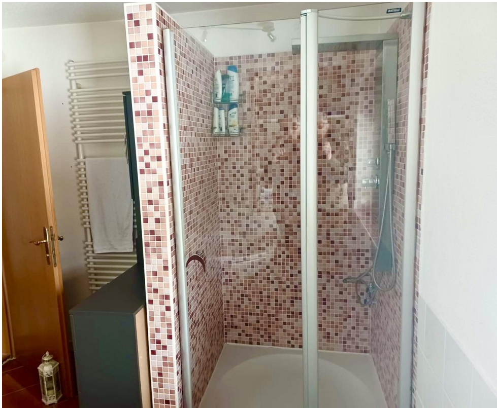
Bad mit Dusche und Whirlpool