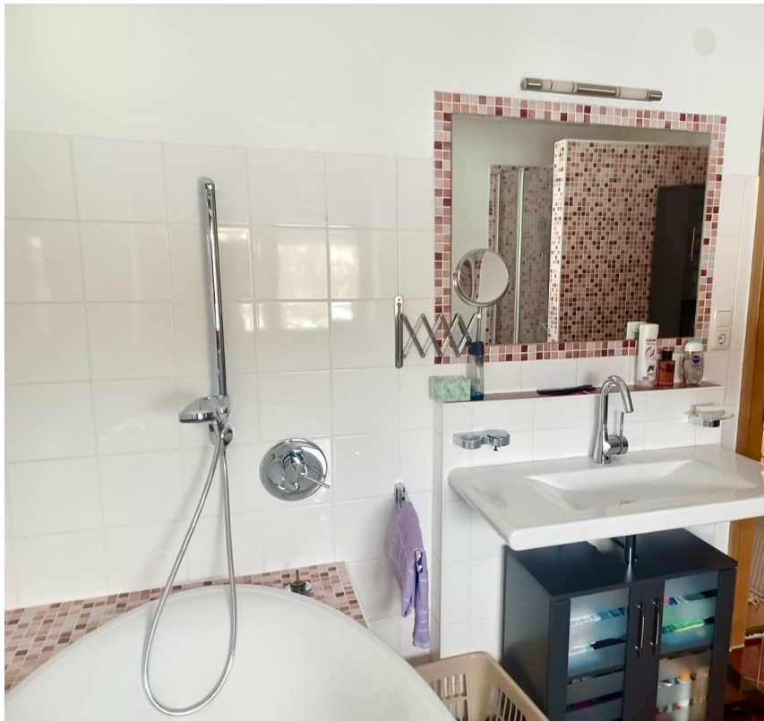
Bad mit Dusche und Whirlpool