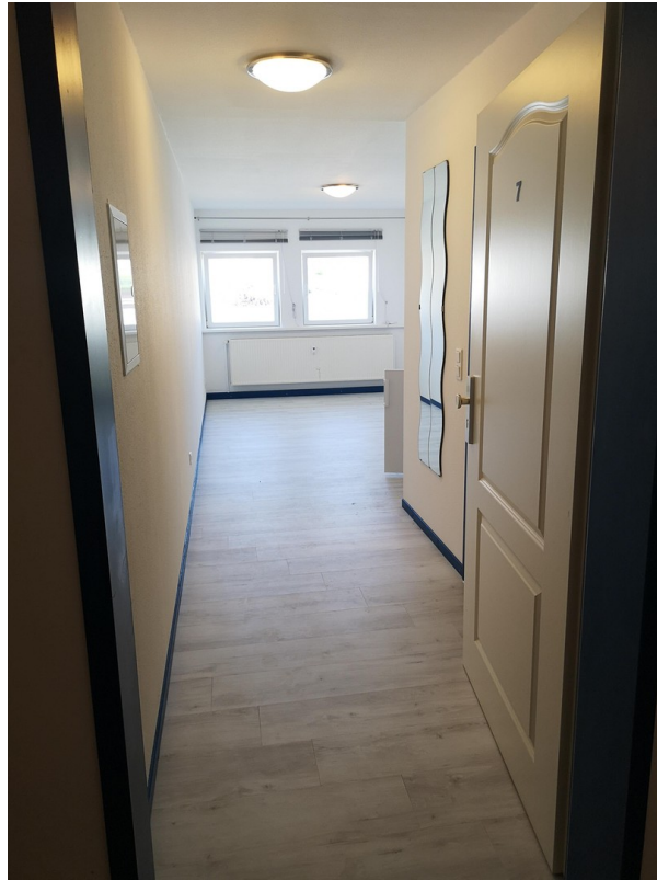
Büro 20 m 2