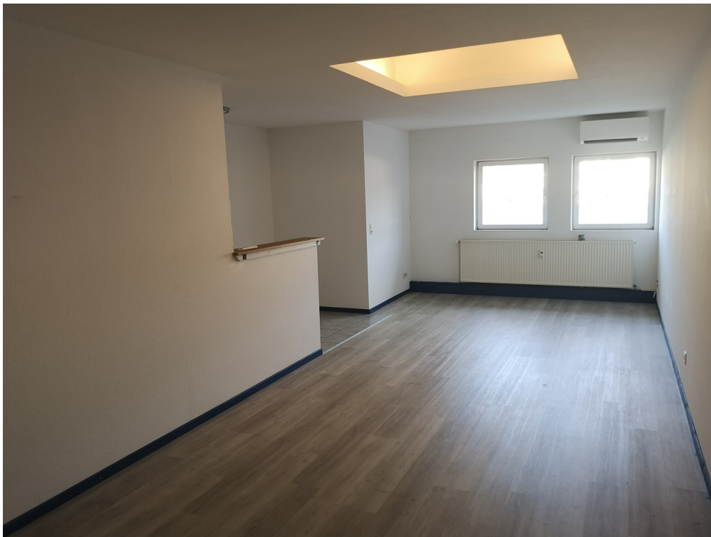
Bürobeispiel 40 m 2