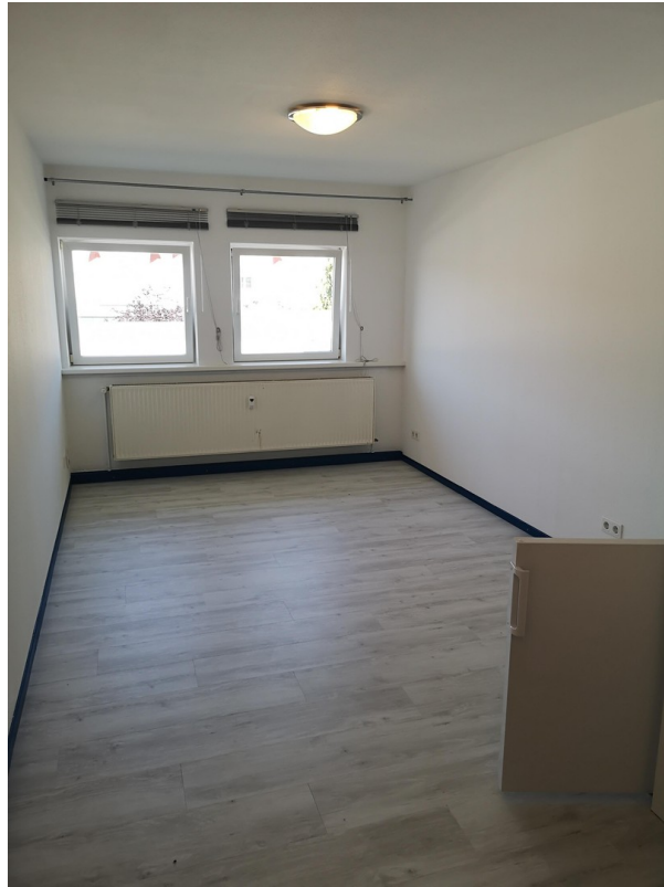
Büro 20 m 2