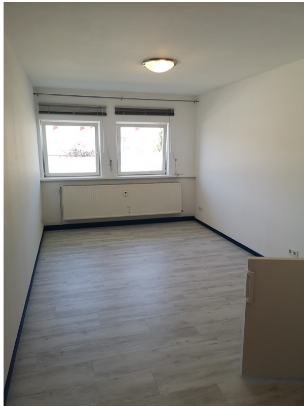
Büro 20 m 2