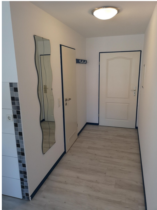
Büro 20 m 2