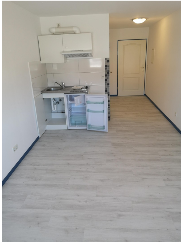
Büro 20 m 2