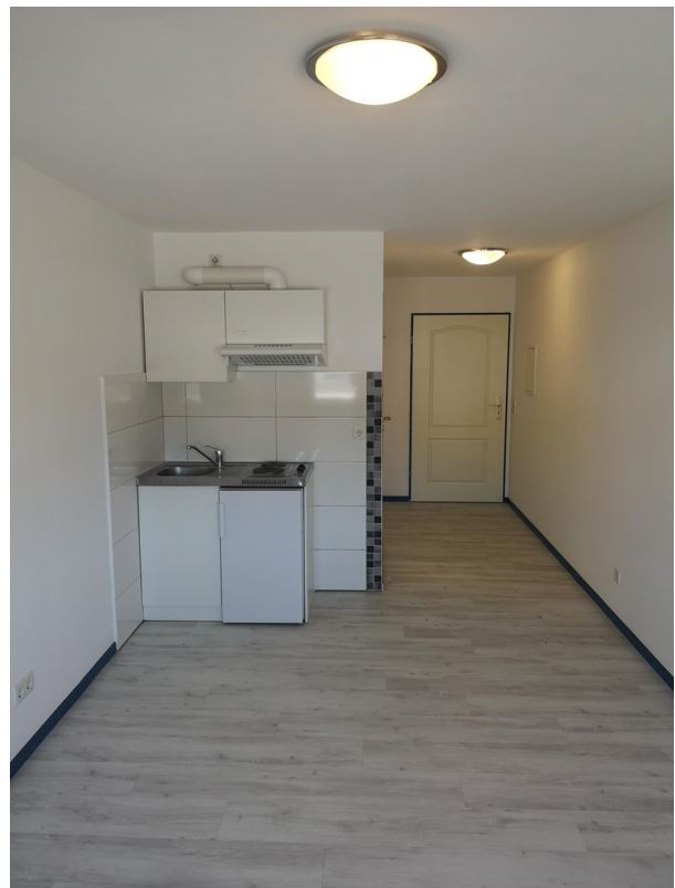
Büro 20 m 2