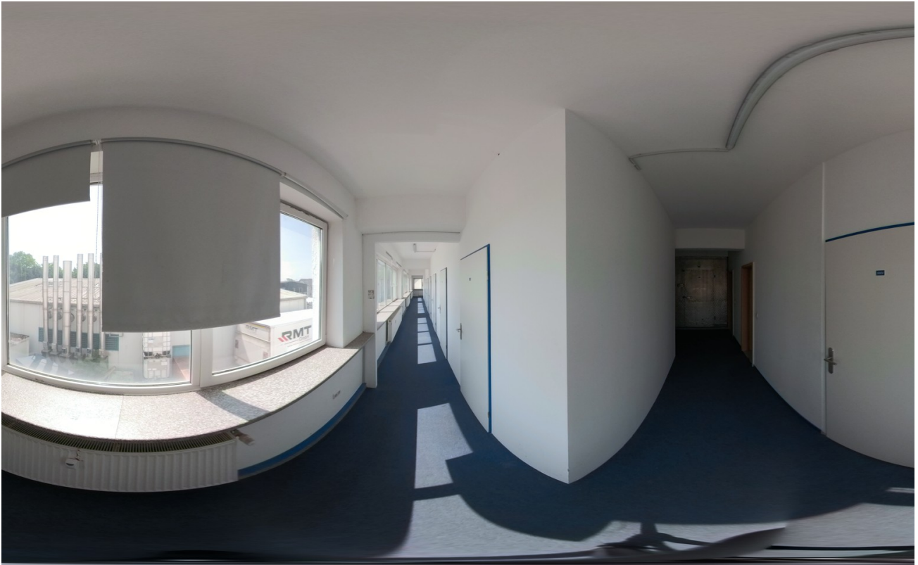
Lager I bis III