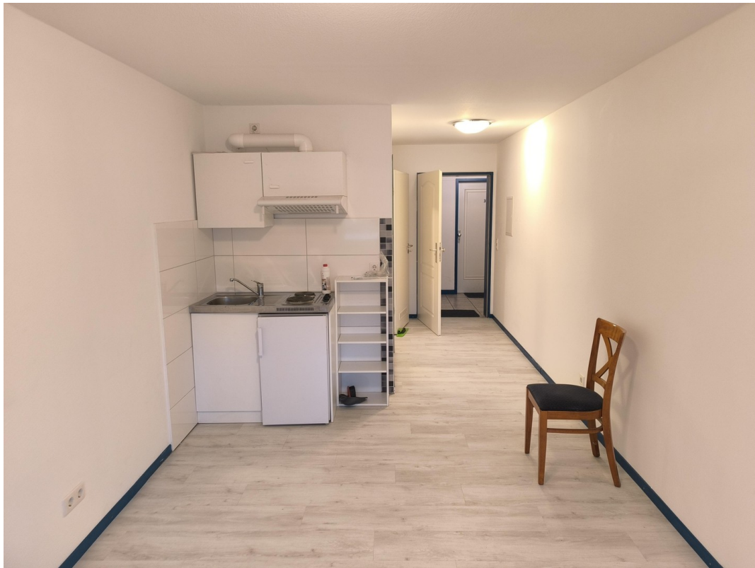
Büro 20 m 2