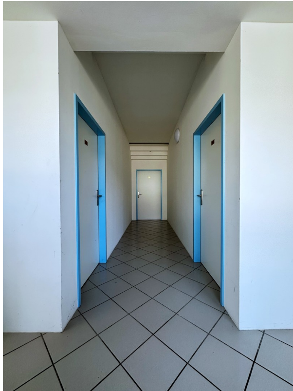
Lageretage 1 Ost