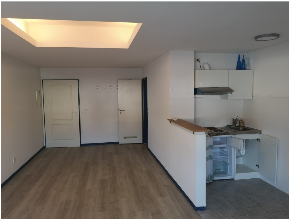
Bürobeispiel 40 m 2