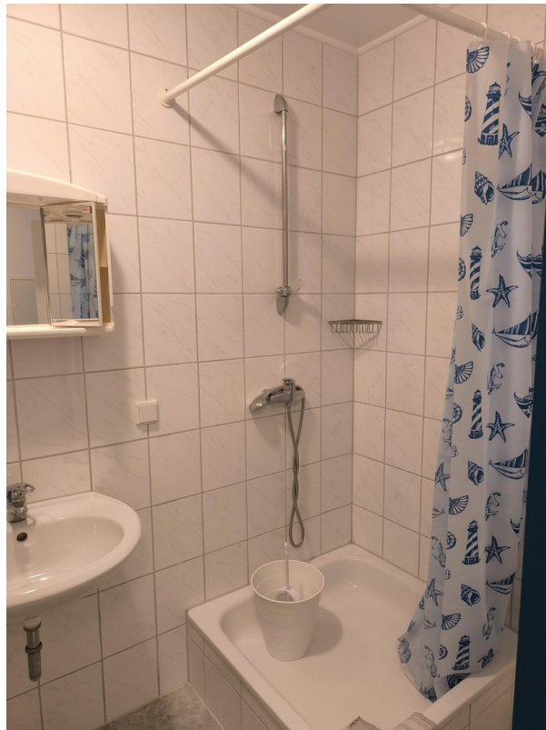
Bad/WC Büro 20 m 2