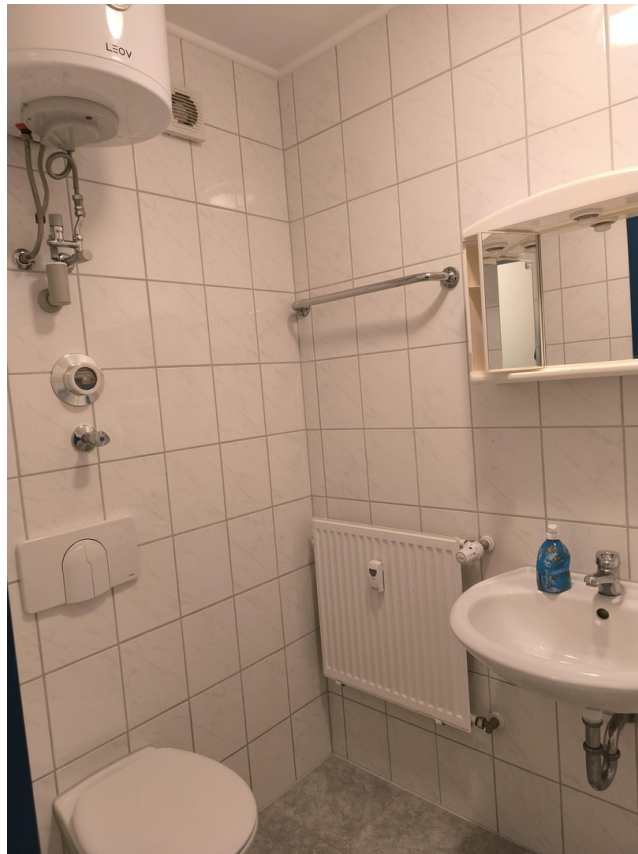
Bad/WC Büro 20 m 2