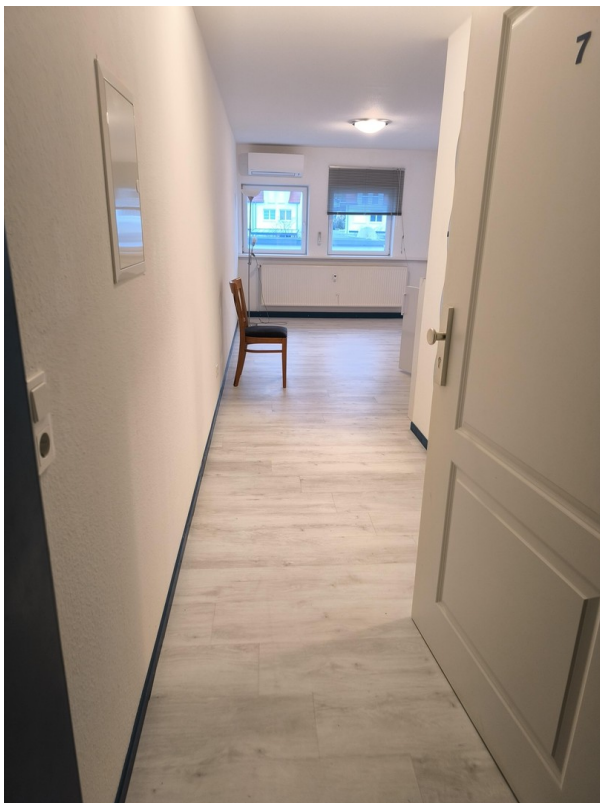
Büro 20 m 2