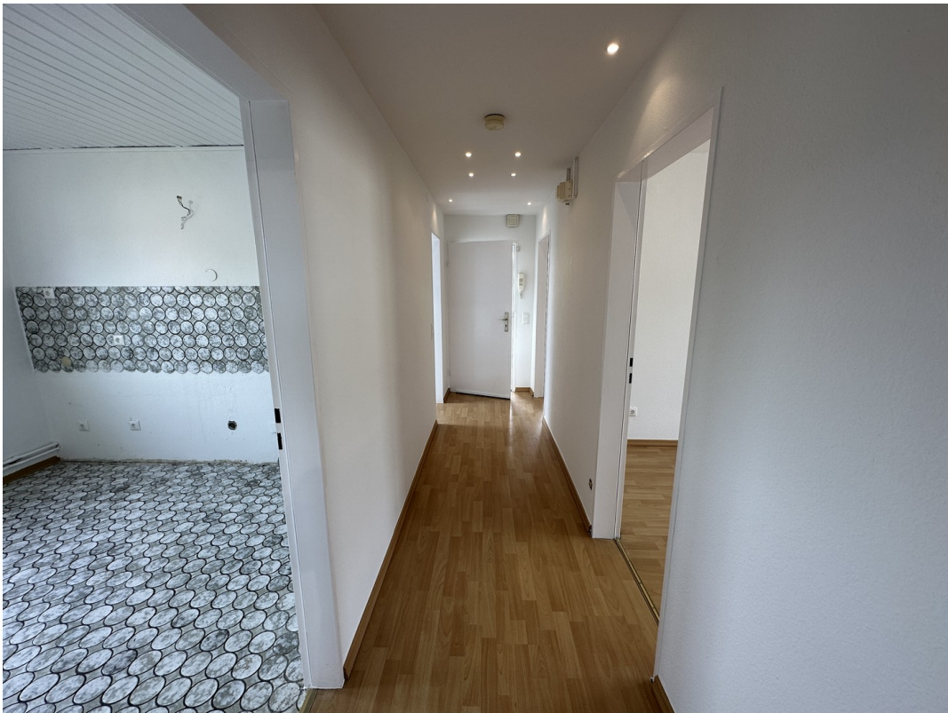
Flur Richtung Eingang