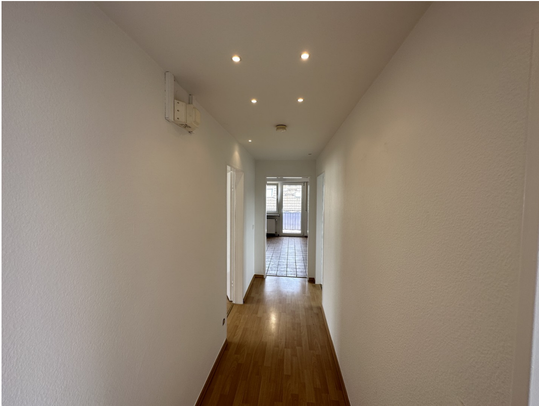
Flur Richtung Eingang