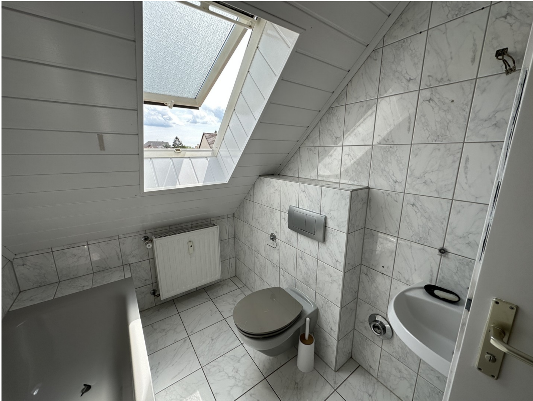
Bad/WC Bild 2