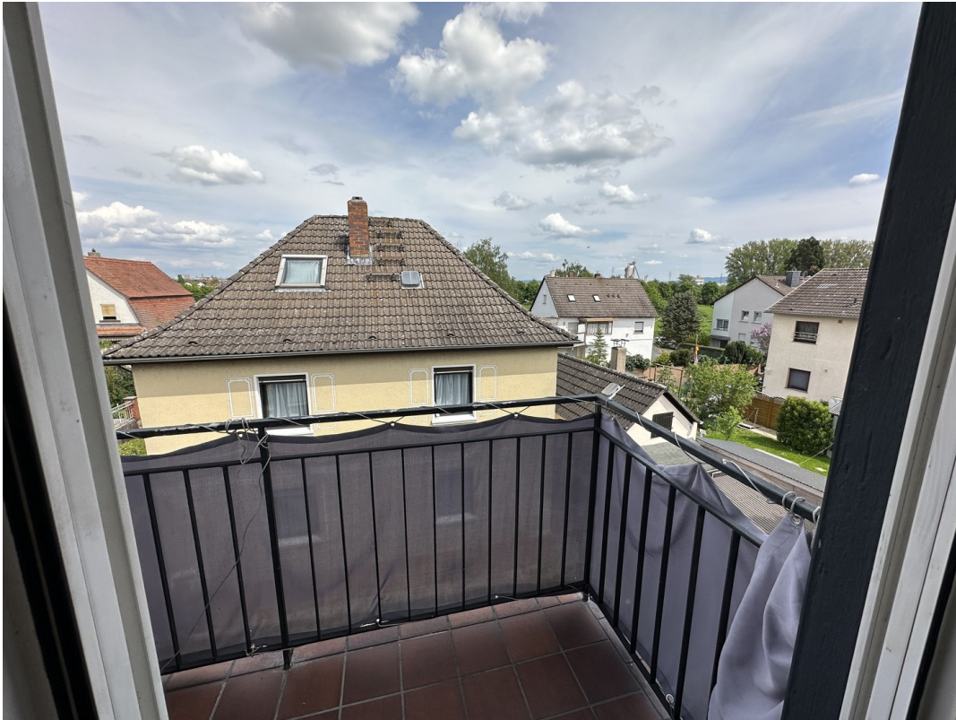
Balkon Blick Main