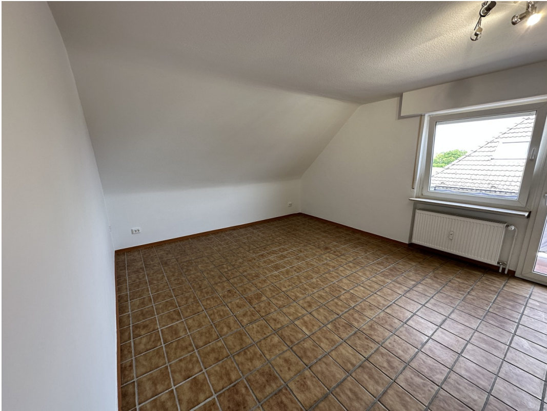
Wohnzimmer Bild nach links