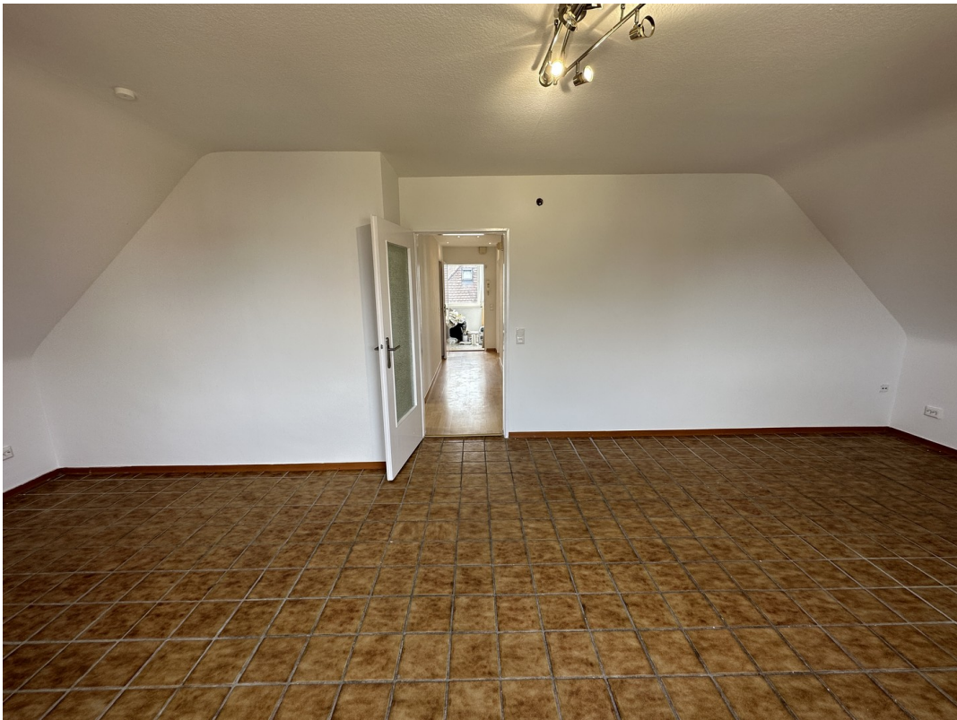
Wohnzimmer Richtung Eingang