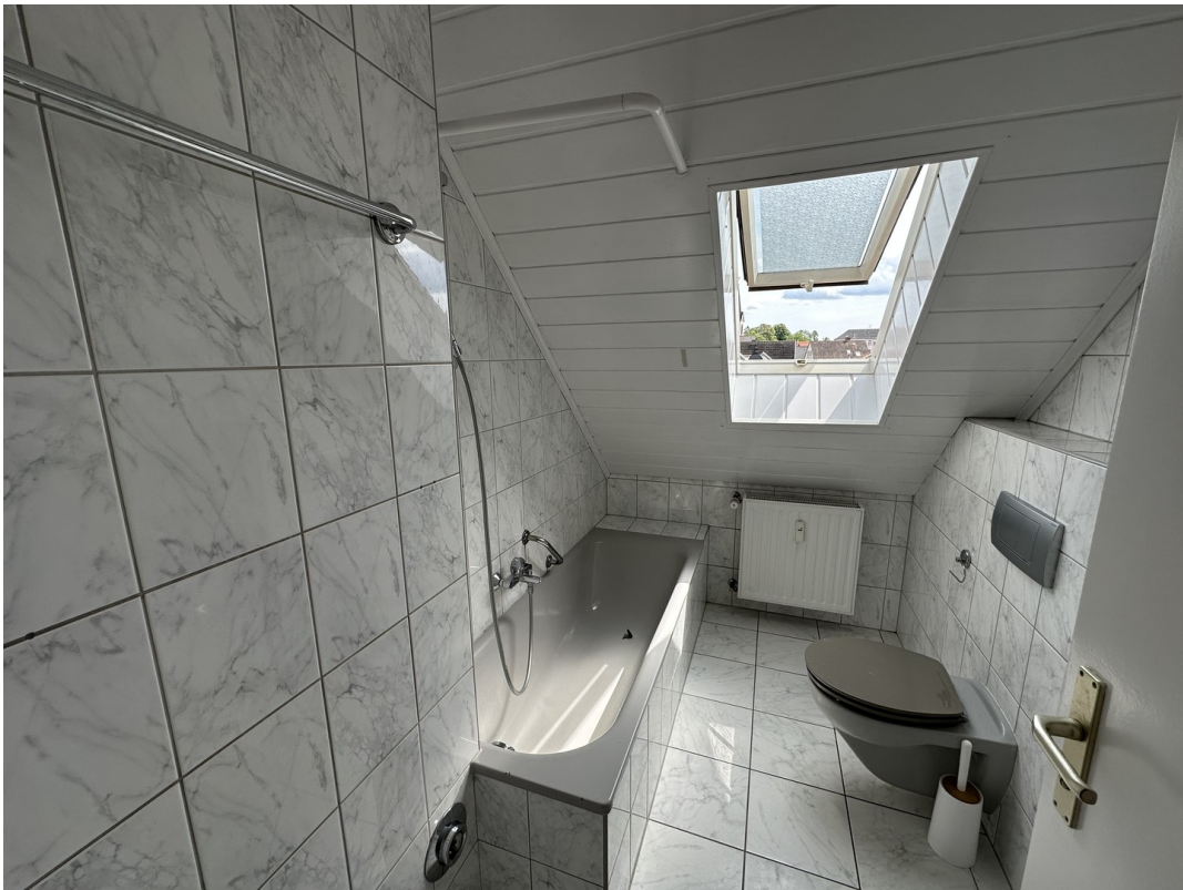
Bad/WC Bild 1