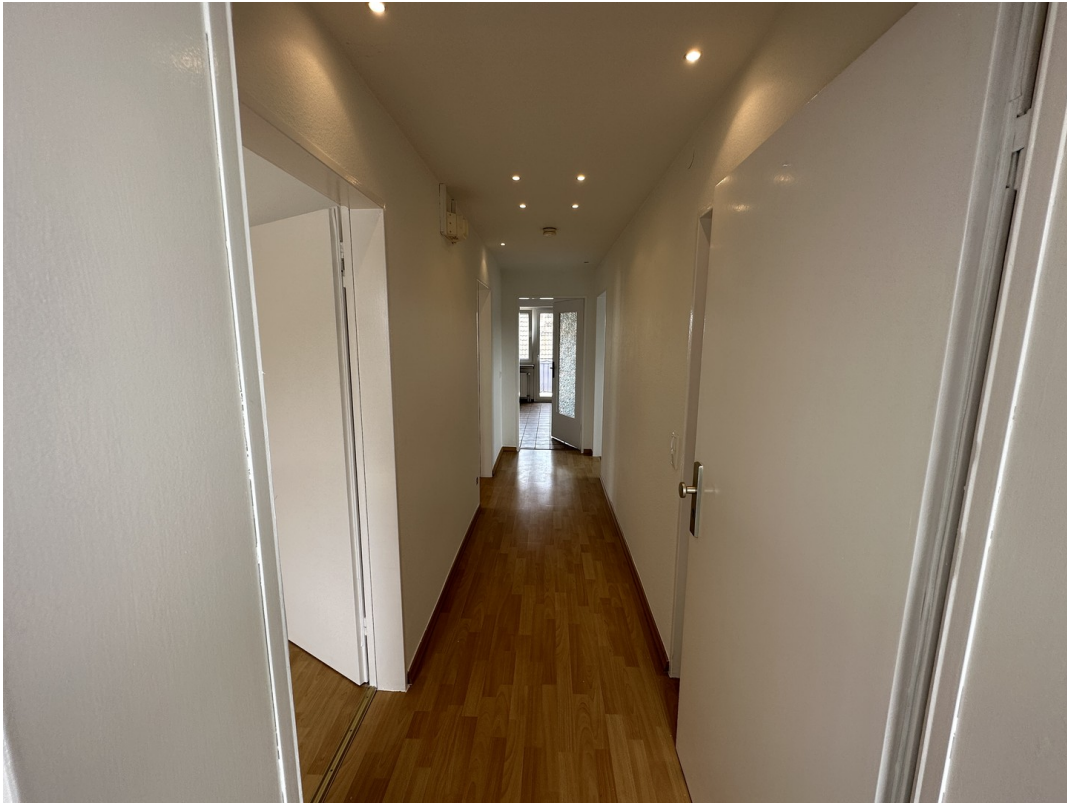
Flur Wohnung Eingang