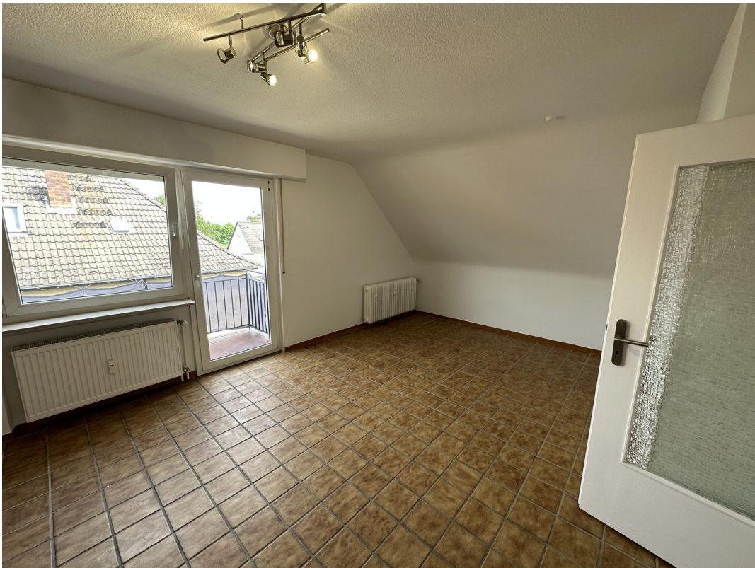
Wohnzimmer Bild nach rechts