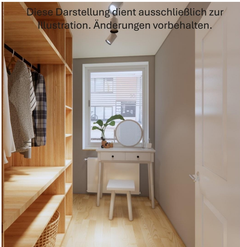
Kleines Zimmer, z.B. Ankleide