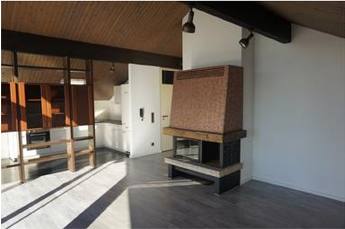
Wohnzimmer mit Kamin