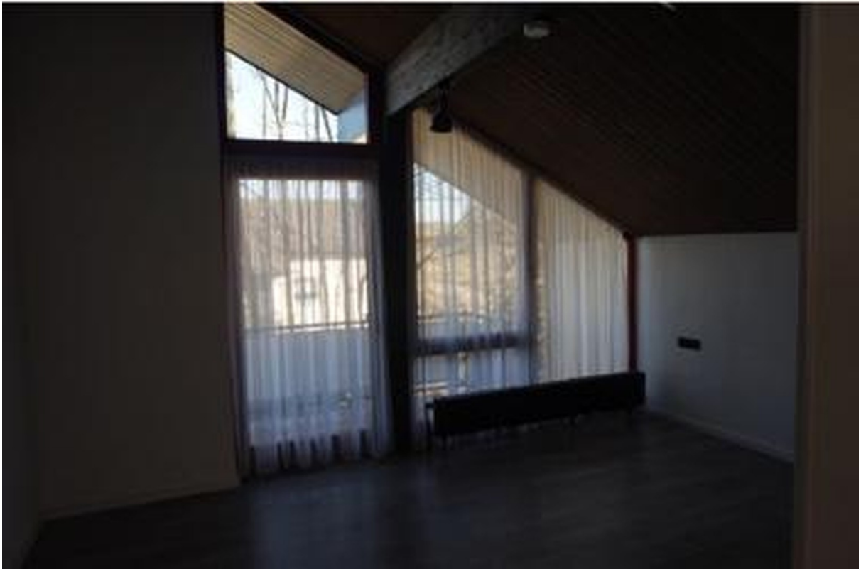
Schlafzimmer mit 1/2 Ostbalkon