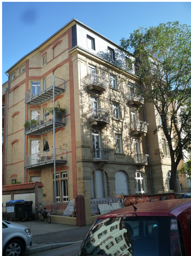
Außenansicht mit Seitenbalkon