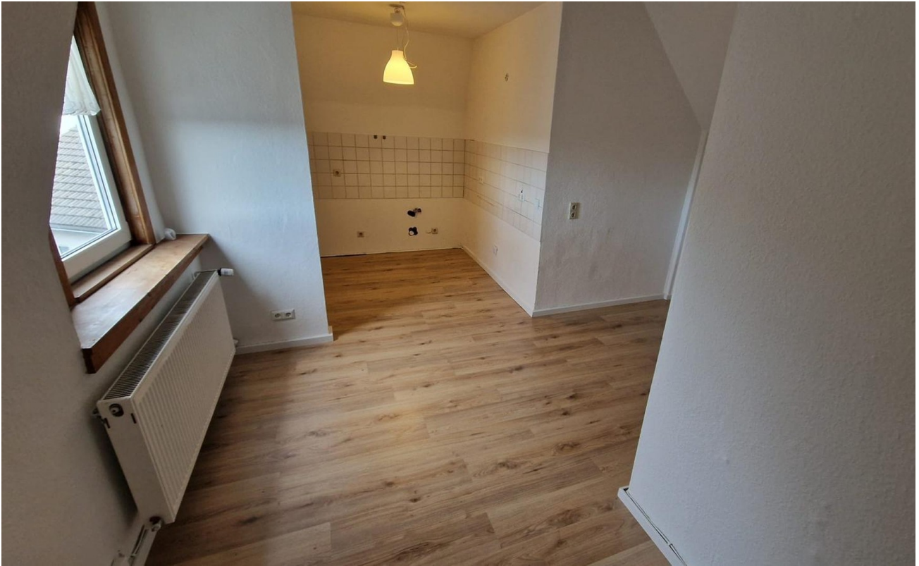
Küche und Essebereich