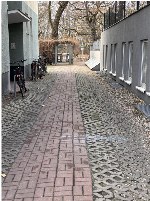
Seiteneingang Hof rechts