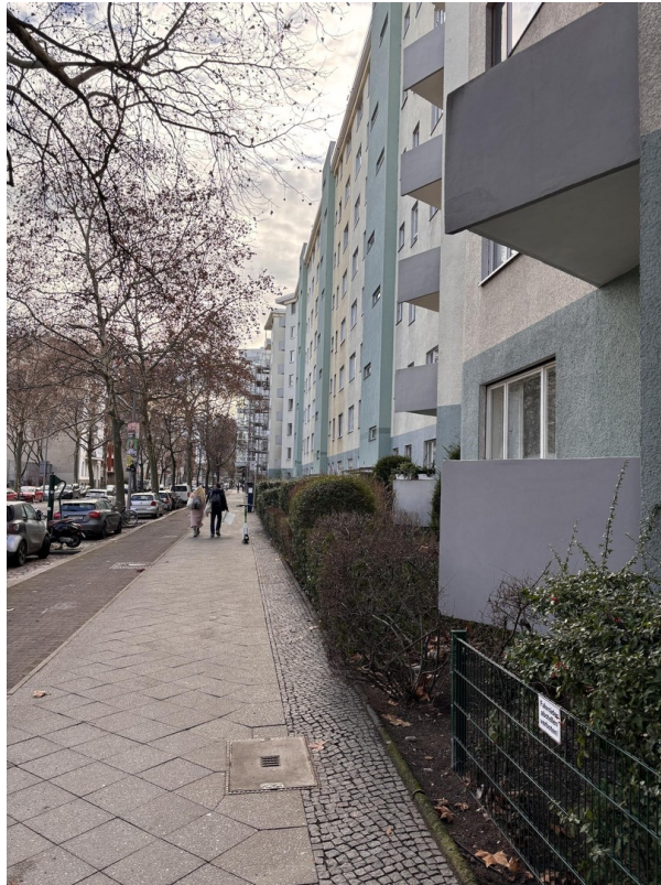
Haus Straßenseite links