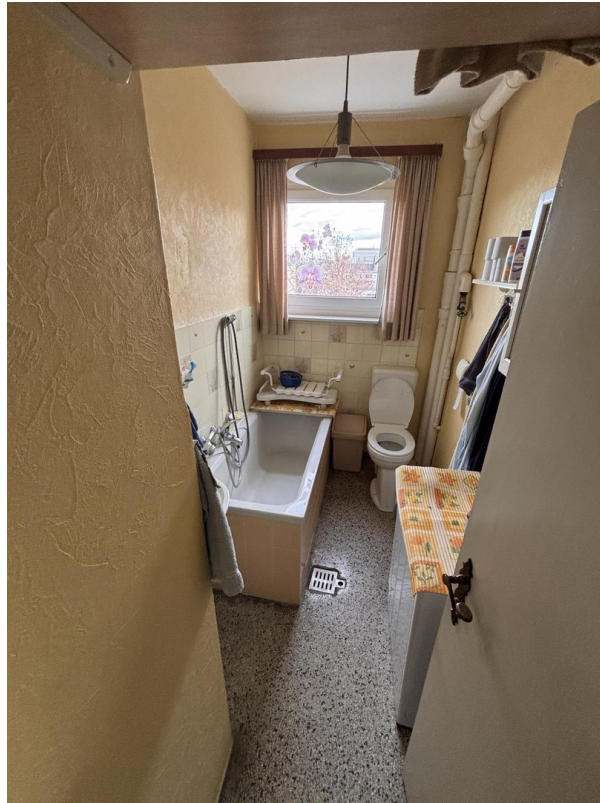
Blick ins Bad