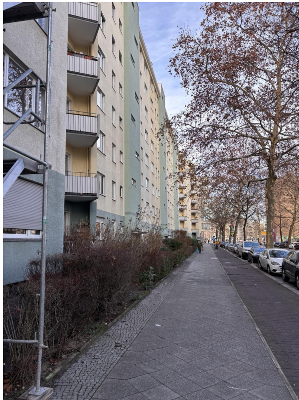
Haus Straßenseite rechts