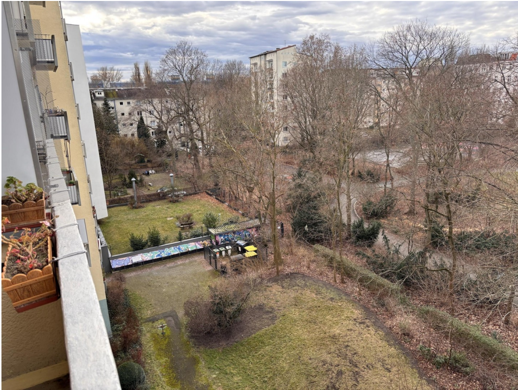
Blick Balkon links