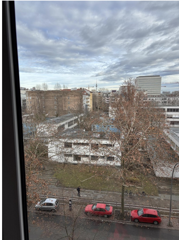
Blick auf Fernsehturm