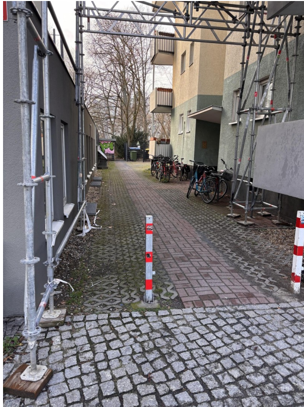
Seiteneingang Hof links