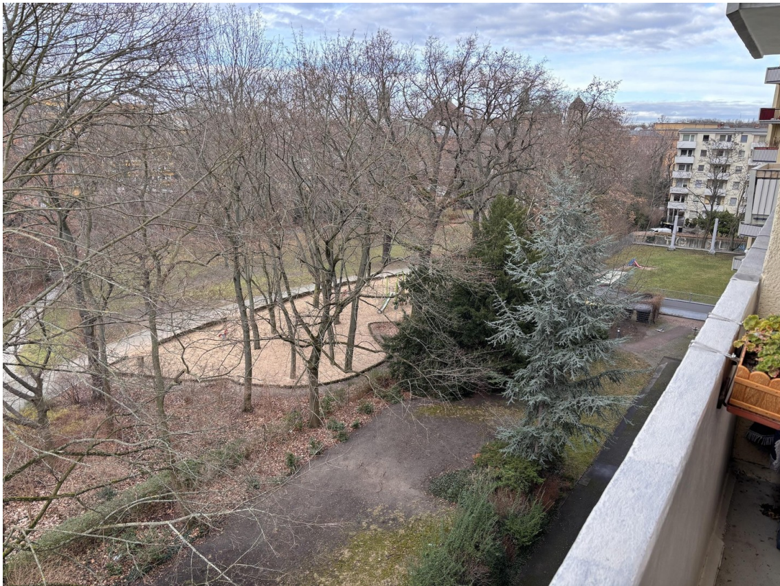
Blick Balkon nach rechts