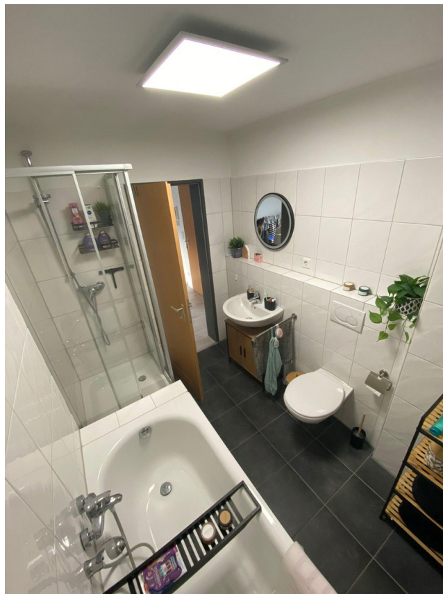
Bad (baugl. Wo.)