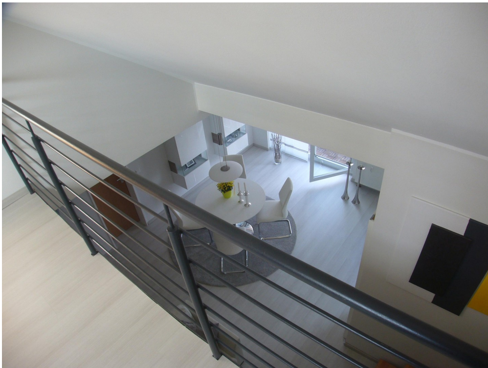
Galerie (baugl. Wo.)