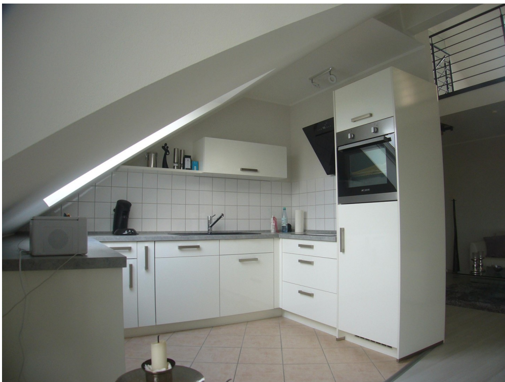
Kochen (baugl. Wo.)