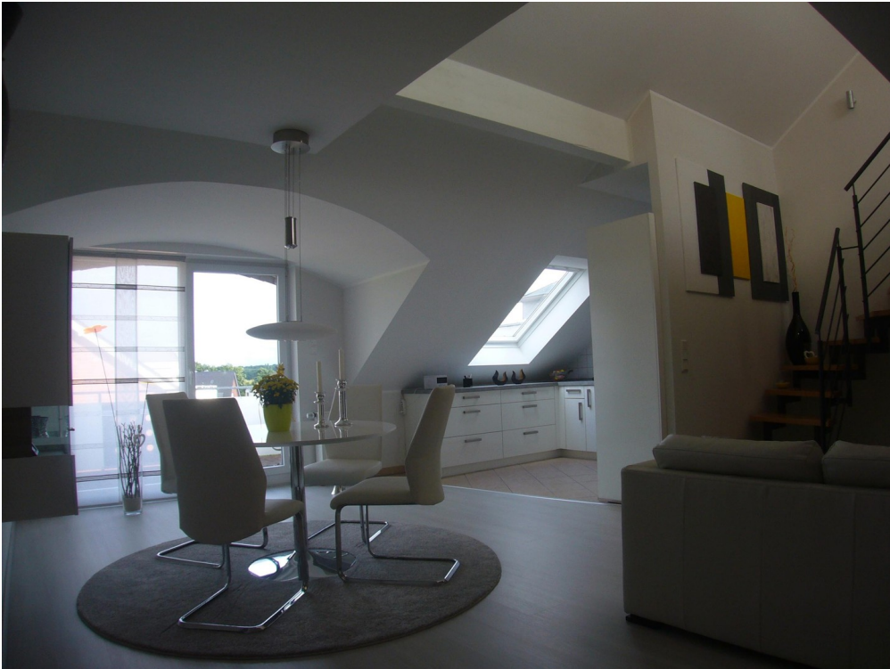
Wohnen/Essen (baugl. Wo.)