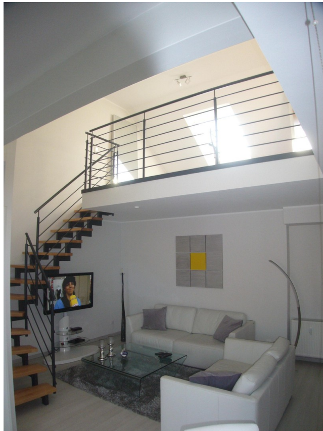
Galerie (baugl. Wo.)