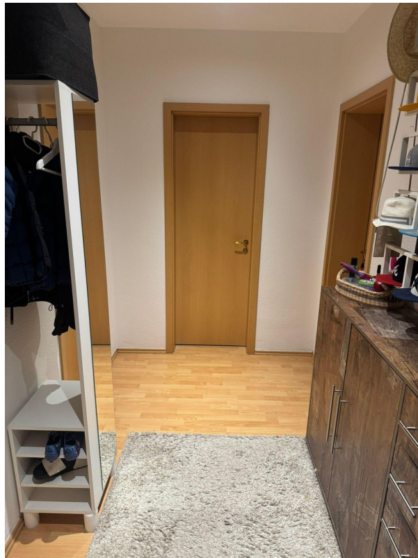
Flur Blick Wohnung