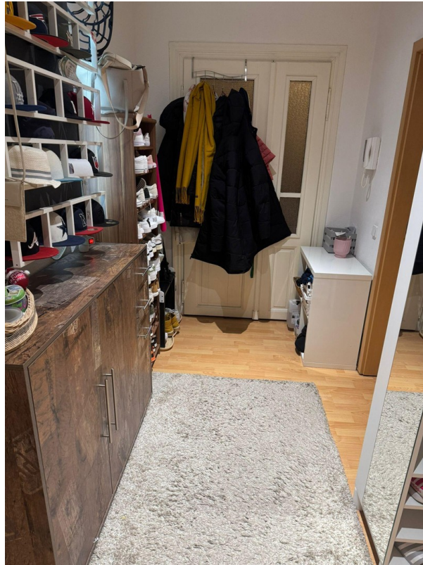
Flur Blick Eingang