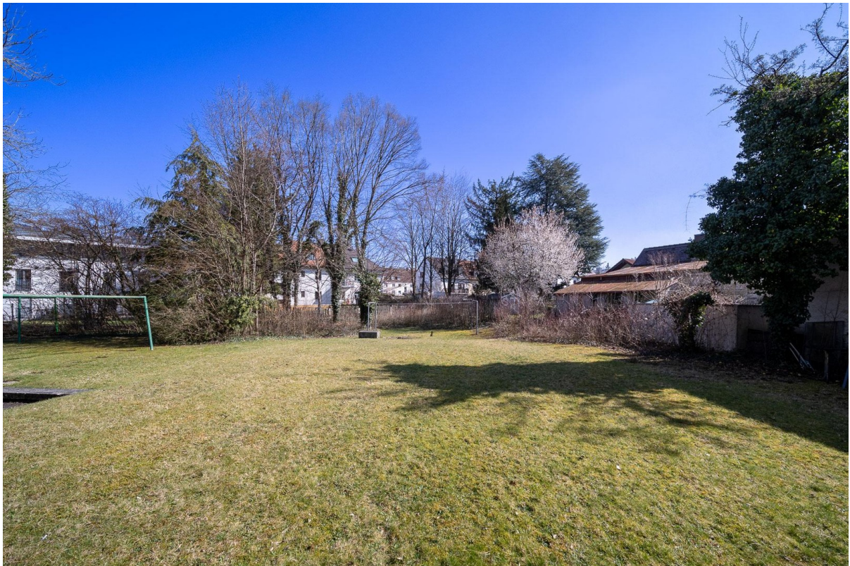
Ansicht Garten Hinterhof