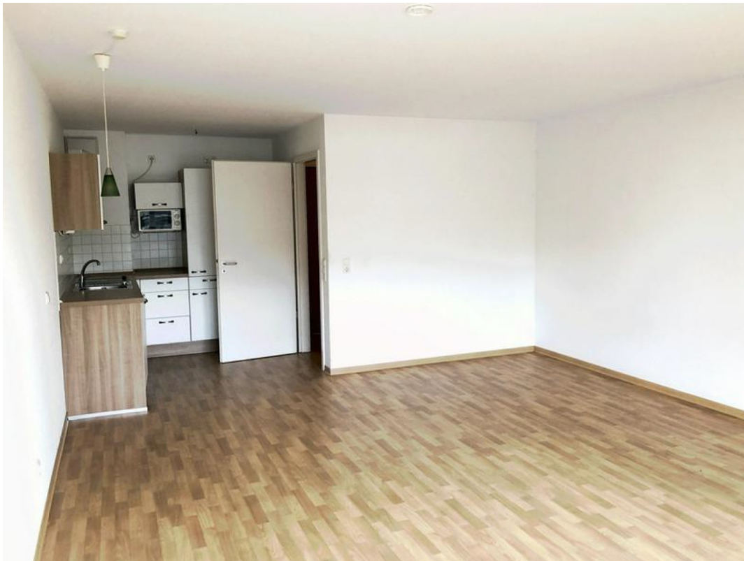
Wohnzimmer mit Küche