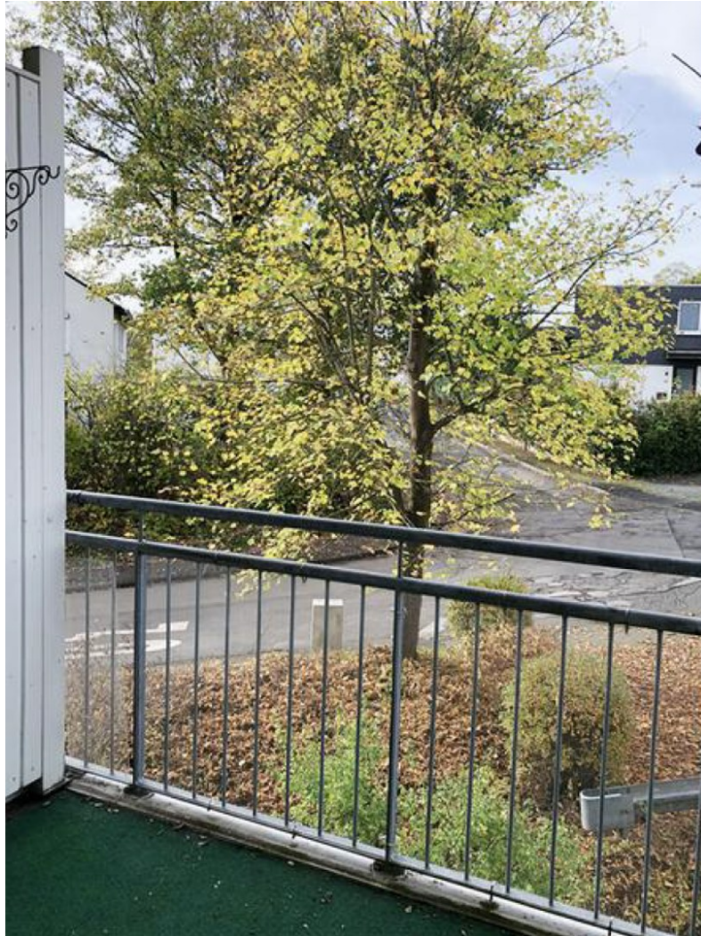
Aussicht vom Balkon