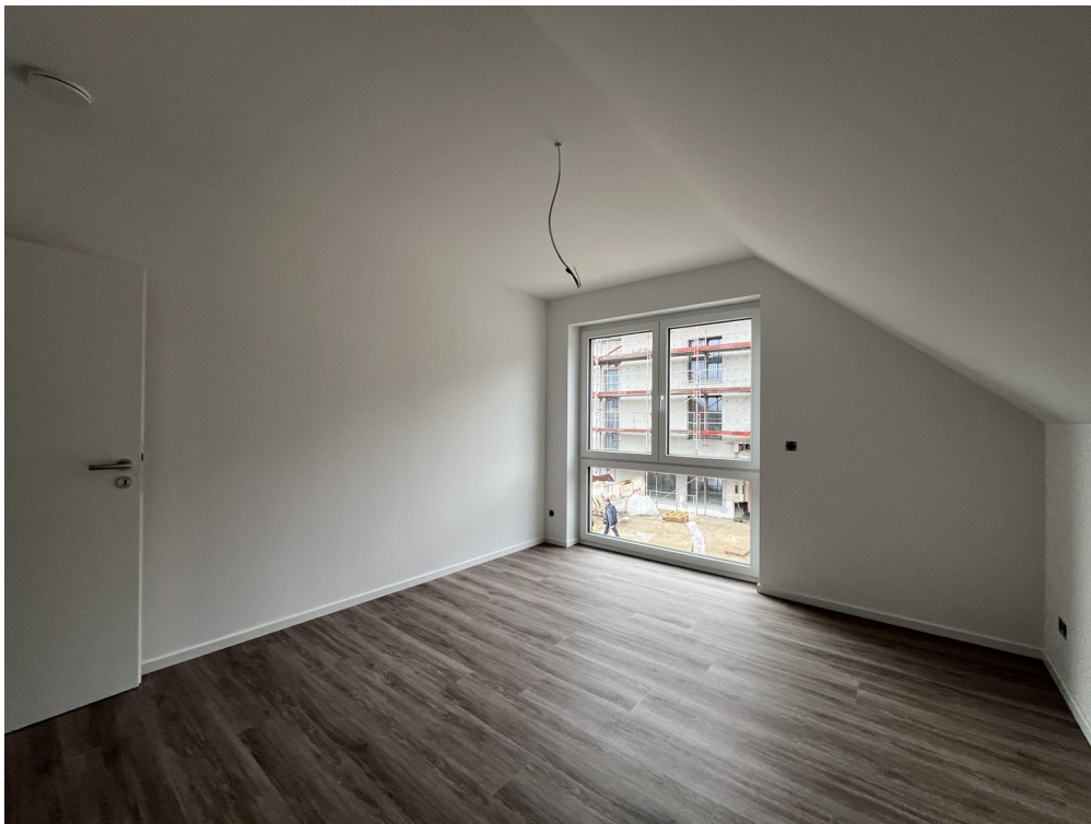
Schlaf-, Kinderzimmer 3 OG