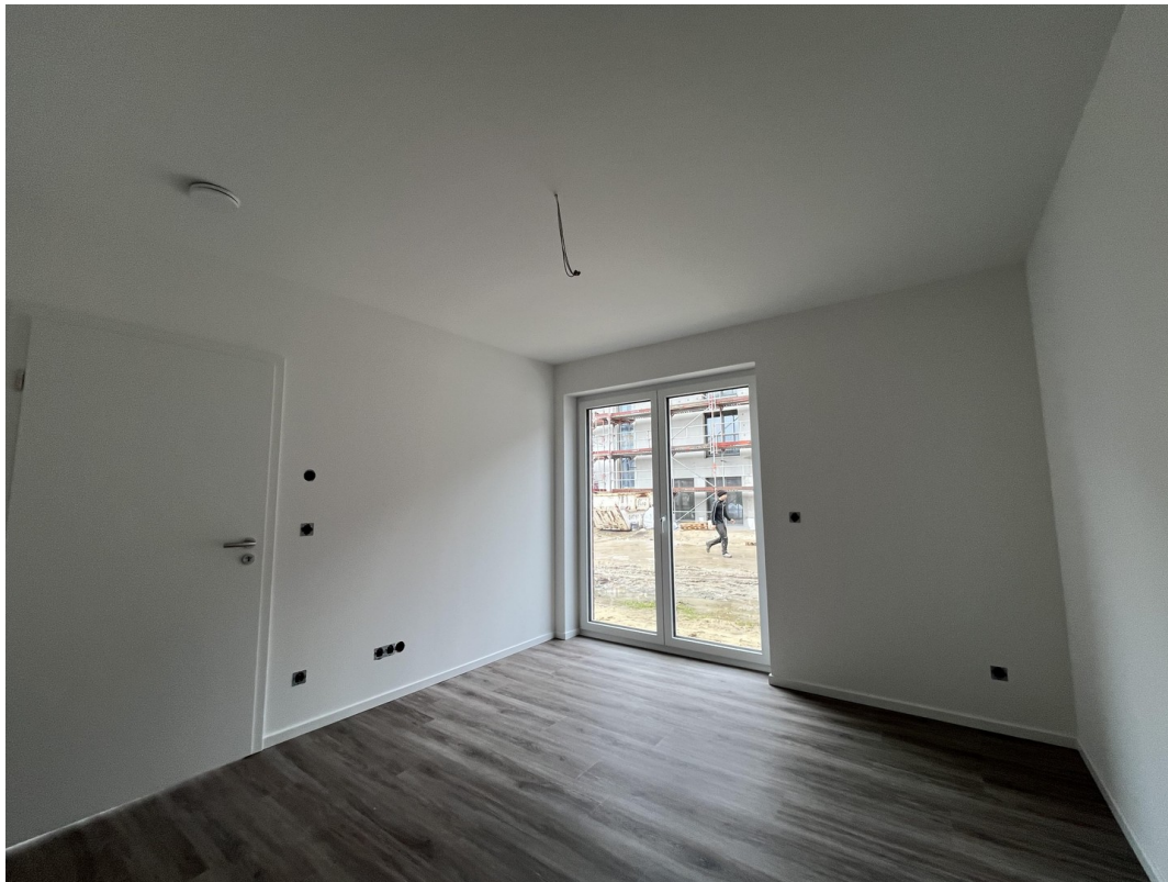
Büro / Gäste-Zimmer im EG