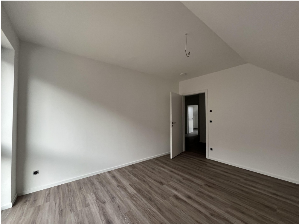
Schlaf-, Kinderzimmer 2 OG