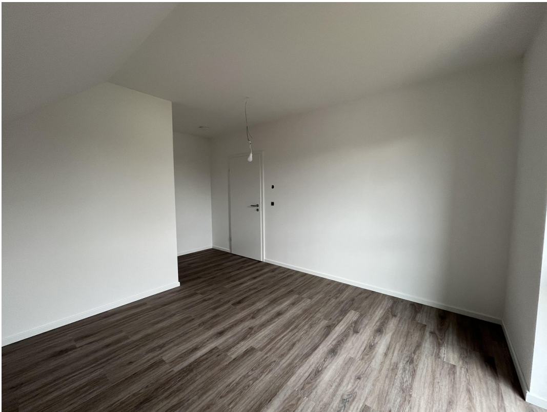
Schlaf-, Kinderzimmer 1 OG