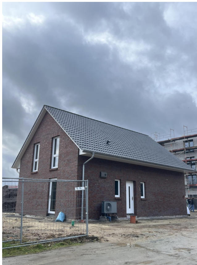
Hauseingangsseite mit Wärmepum