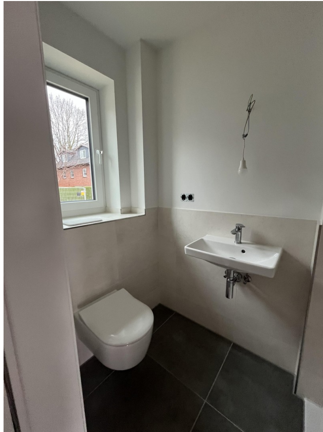
Gäste-WC mit Dusche