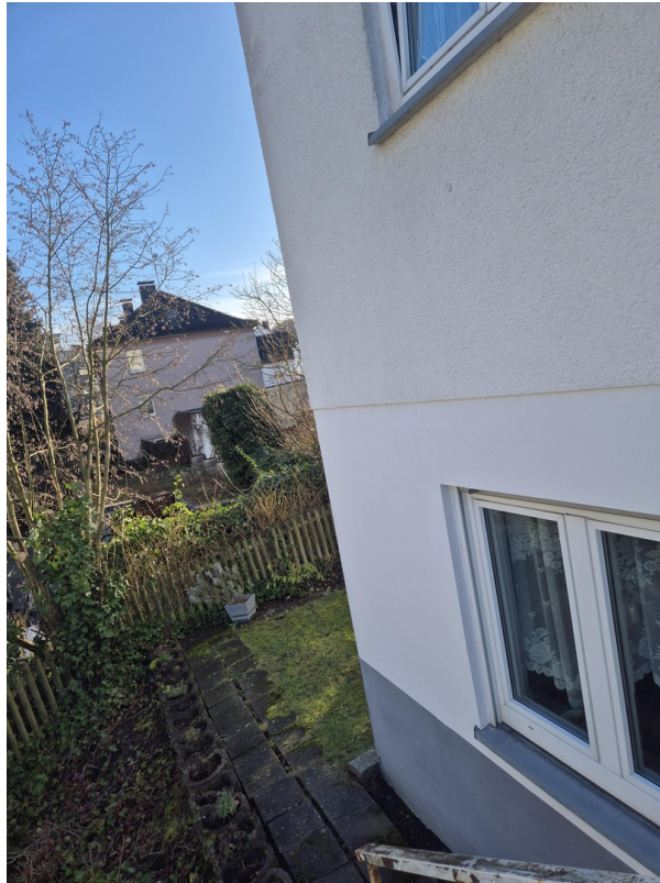
Zugang zum Garten