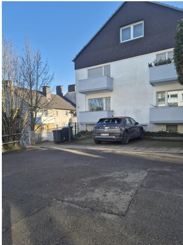
2 Stellplätze/Zugang zum Haus