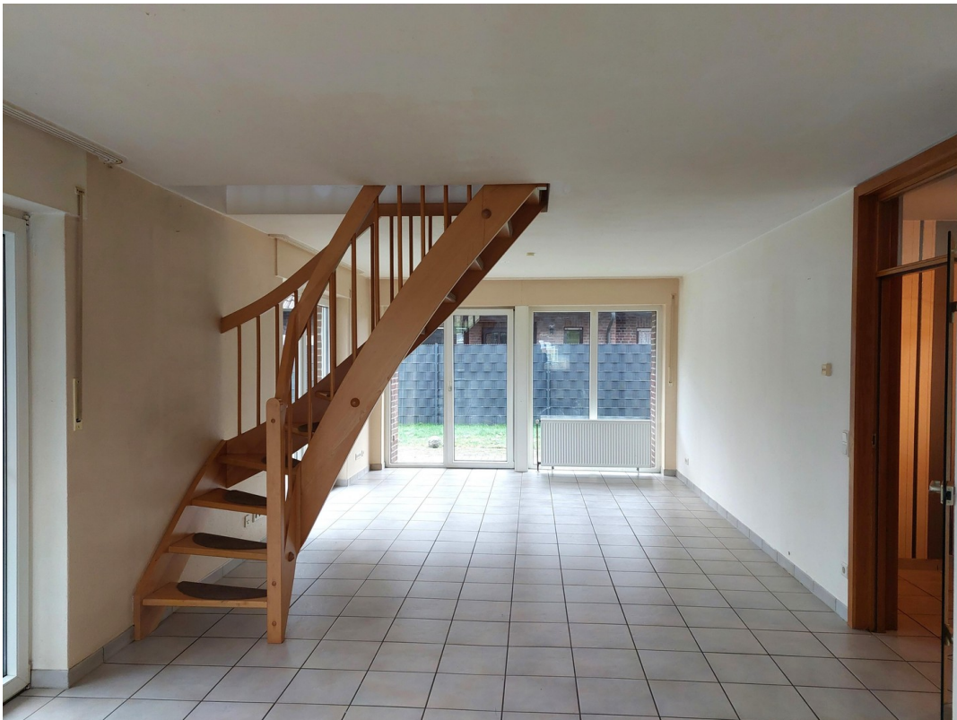
Wohn- / Esszimmer