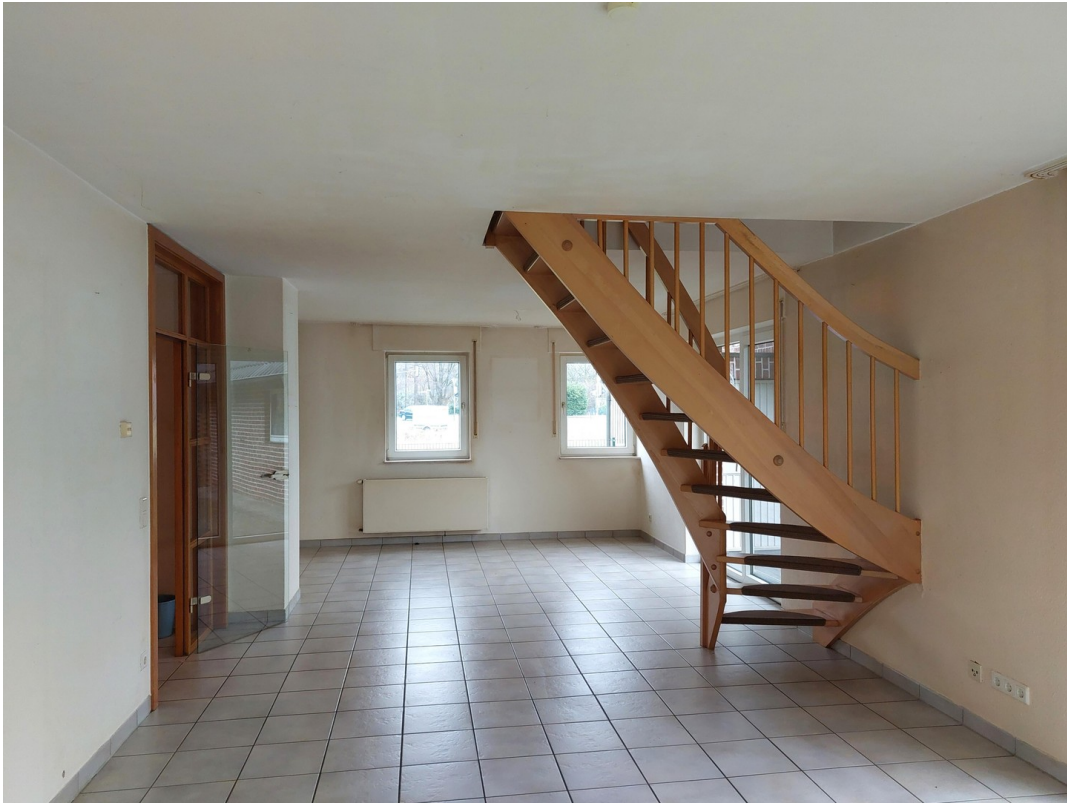
Wohn- / Esszimmer