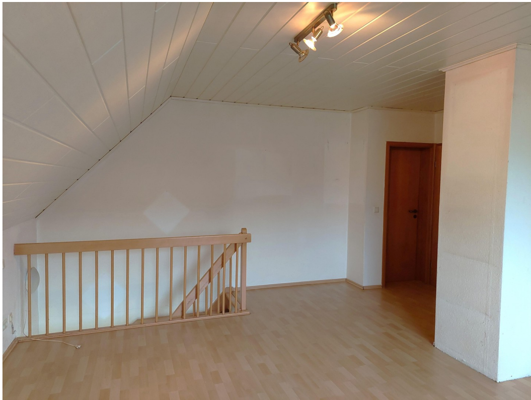
Schlafzimmer OG Zugang