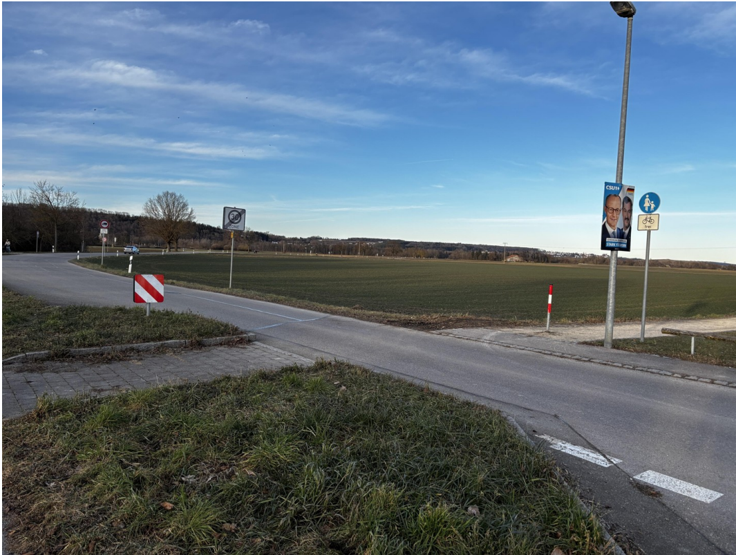
3 min Fußweg