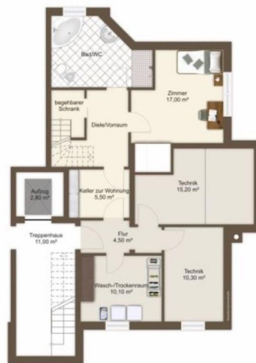
Souterrain und UG