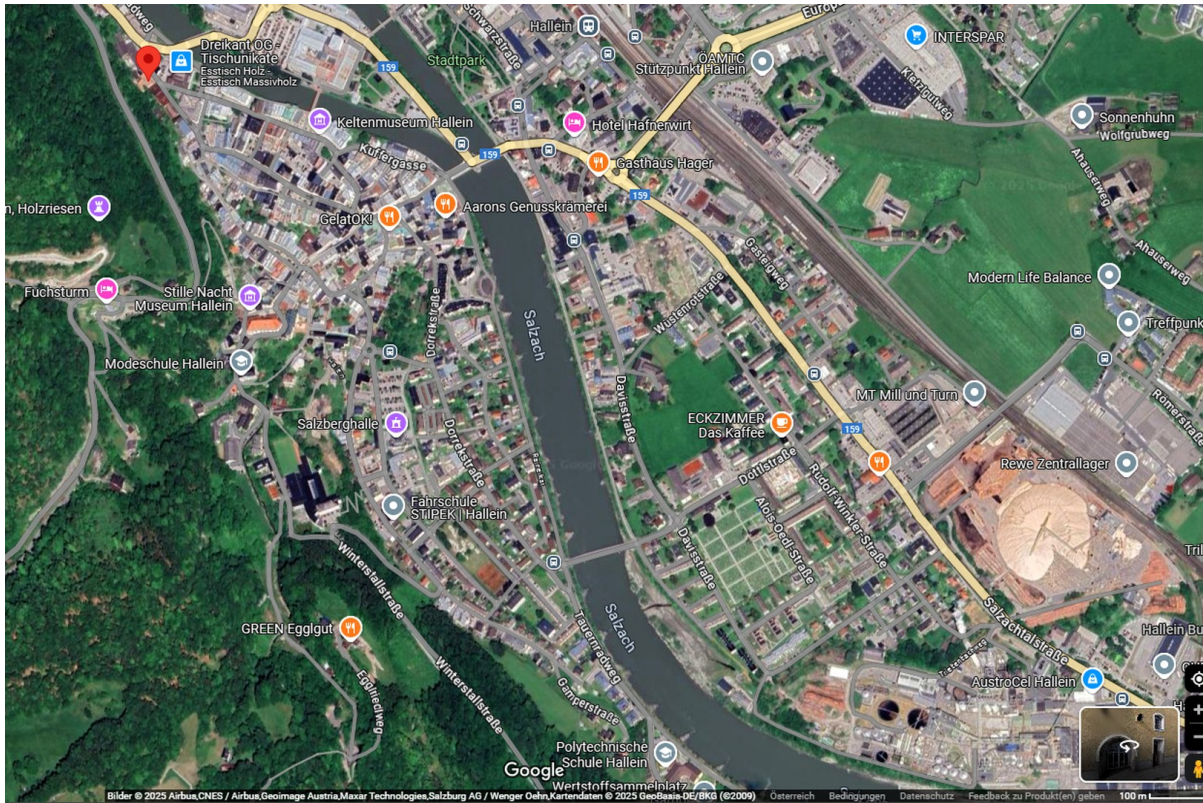
Lage (links oben)