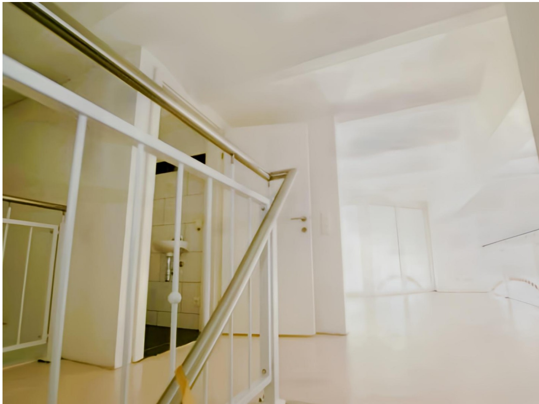
Stiege zur Galerie