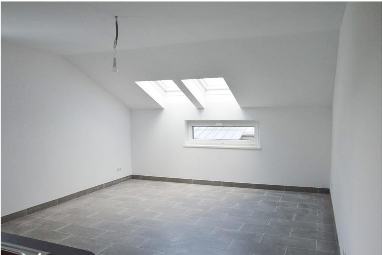
Wohn- & Essbereich