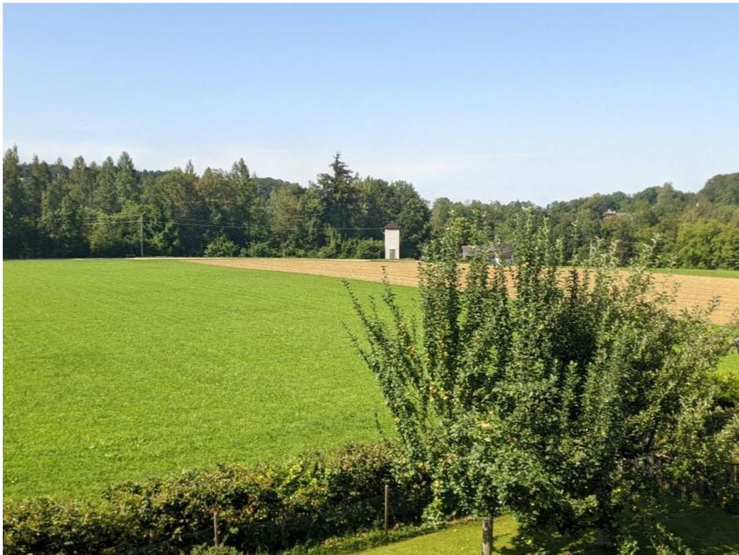
Blick nach Süden