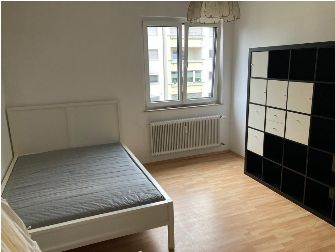
Weiteres Zimmer 2