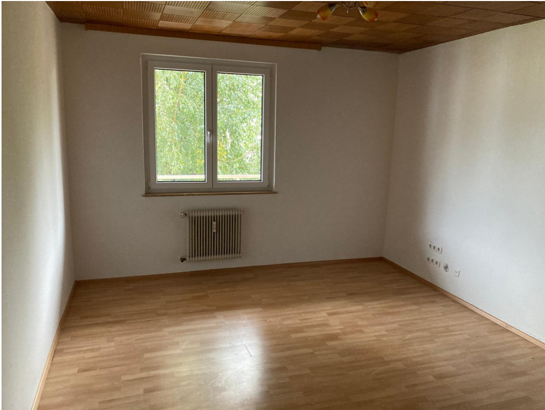
Weiteres Zimmer 3