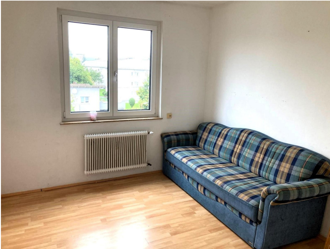
Weiteres Zimmer 1