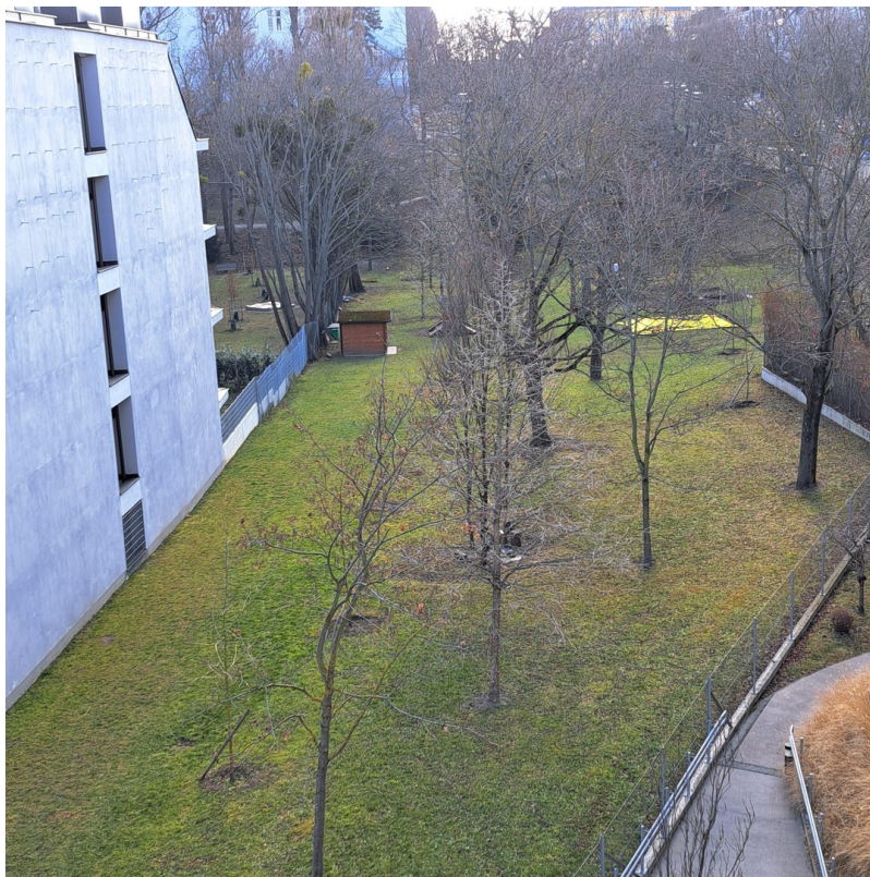
Ausblick vom Wohnzimmer