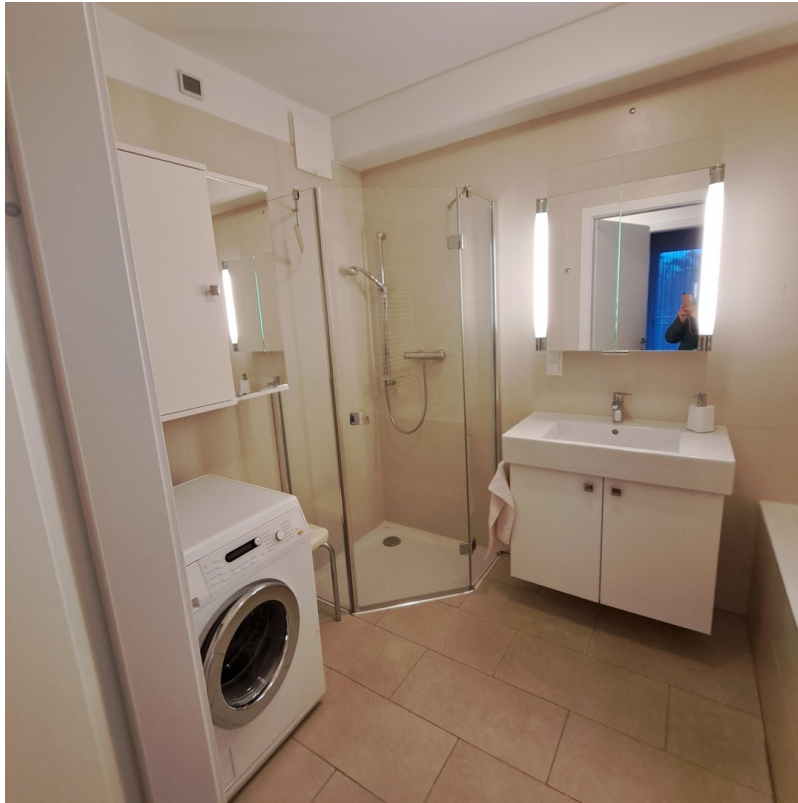
Bad mit Miele Waschmaschine