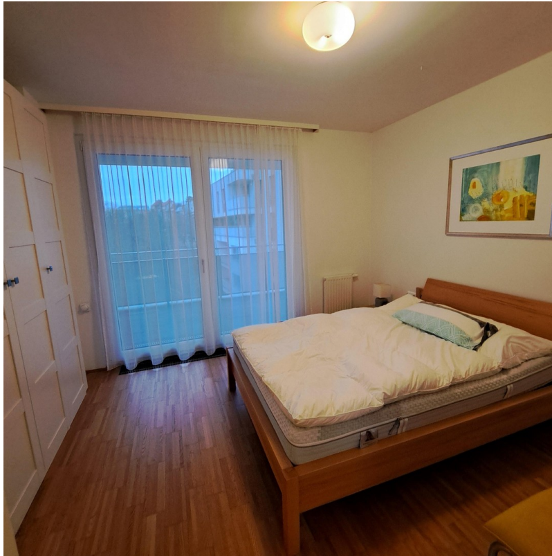
Schlafzimmer mit Balkonausgang