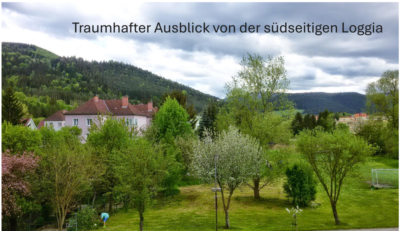
Traumhafter Ausblick von der südseitigen Loggia