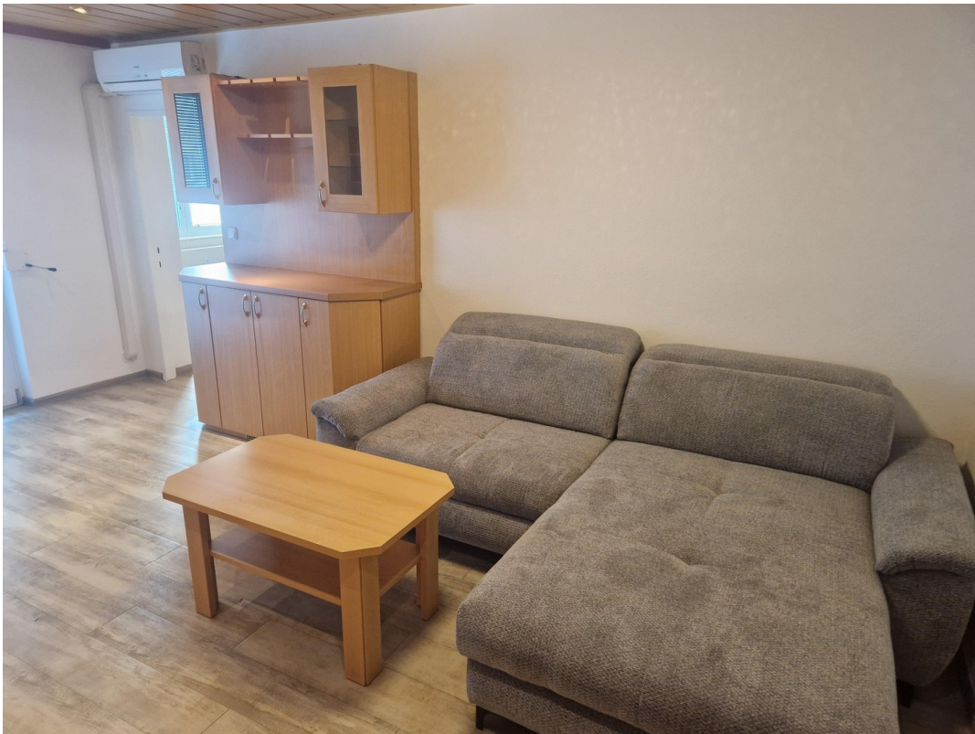
Wohnzimmer mit neuer Couch