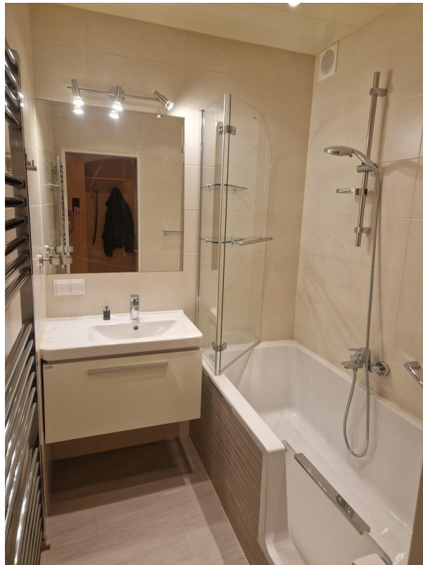
Badezimmer mit Wanne