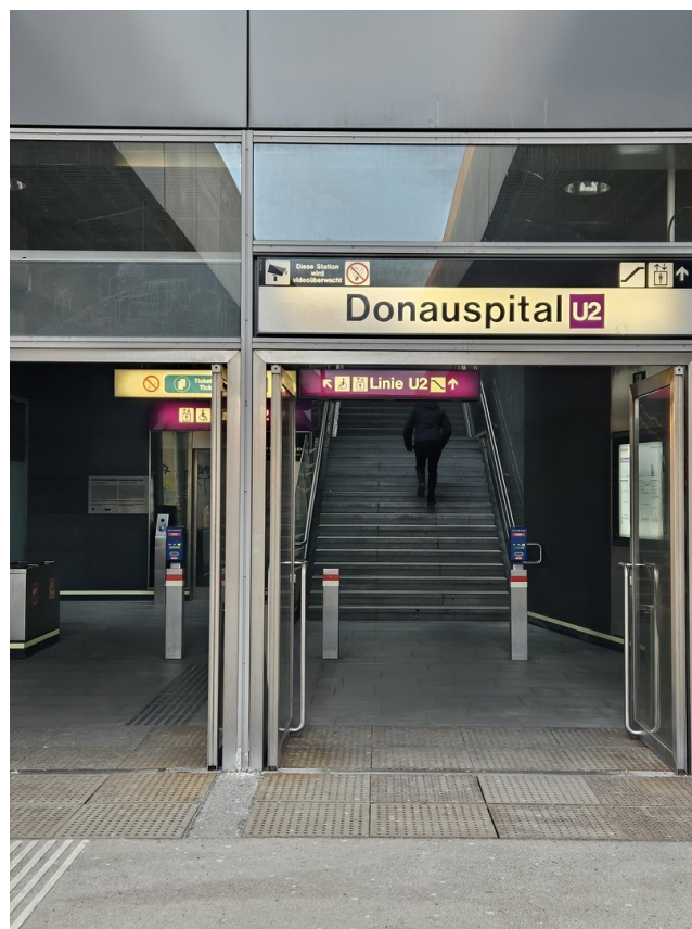
U2 Haltestelle Donauspital