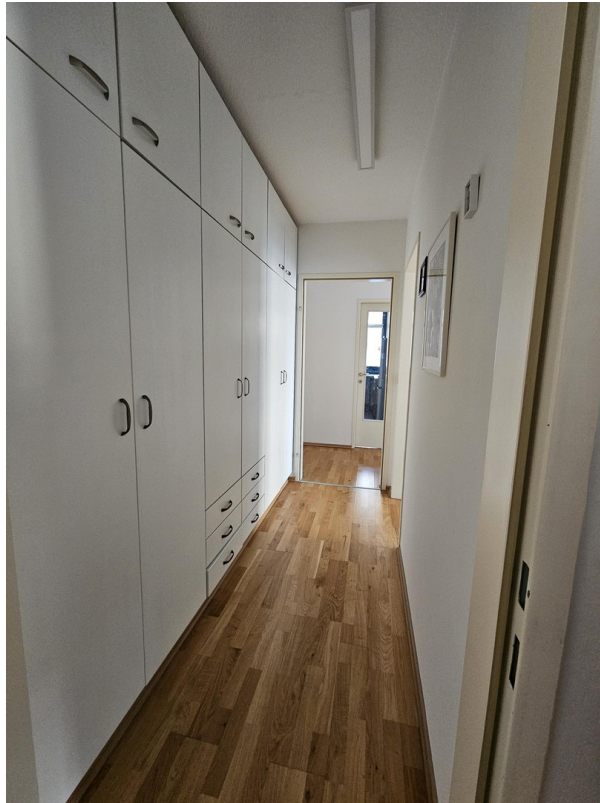
Flur mit Einbauschränk