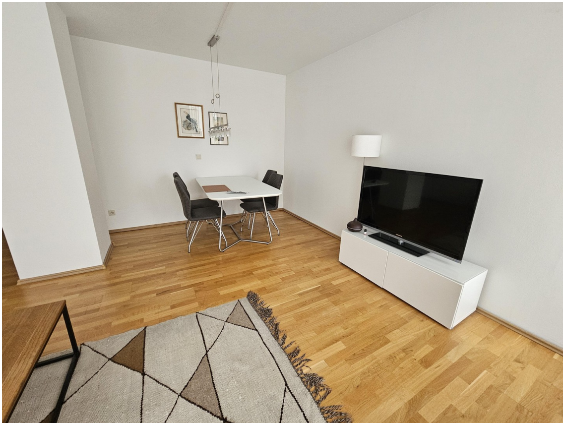
Essbereich im Wohnzimmer