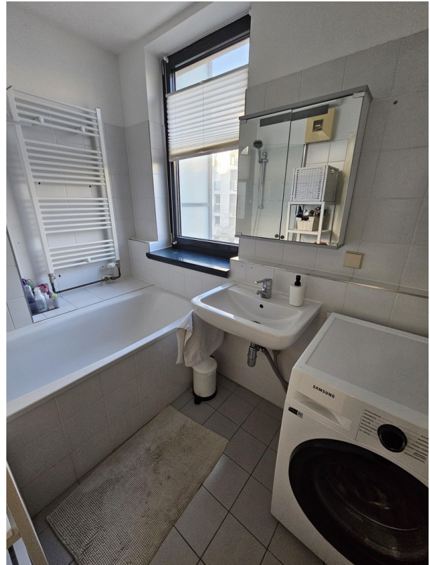
Bad mit Waschmaschine