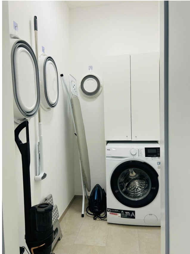
Abstellraum / WM-Anschluss