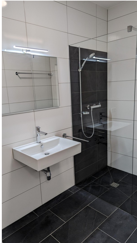
Bad / Dusche