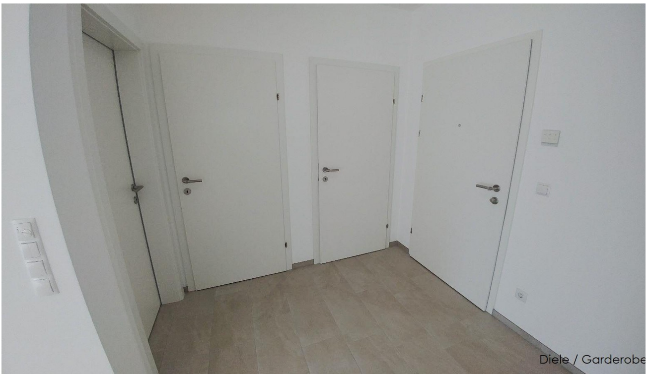
Vorraum / Diele