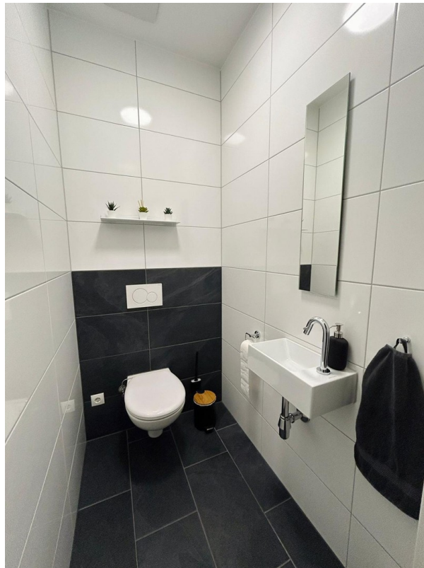
WC / Handwaschbecken