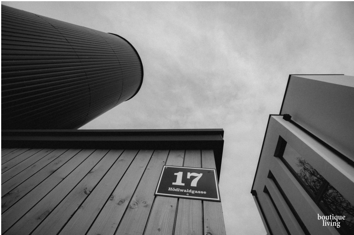
BOUTIQUE LIVING - Beispielbild