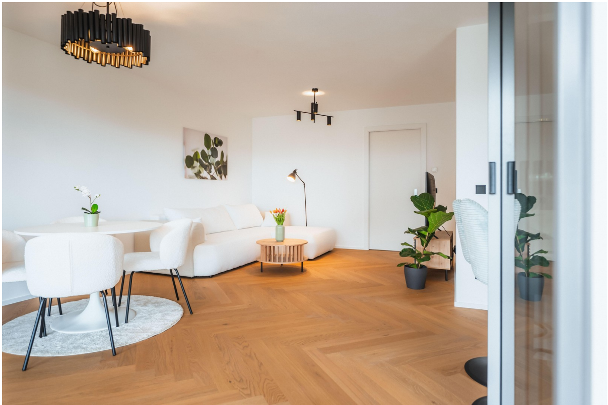
BOUTIQUE LIVING - Beispielbild