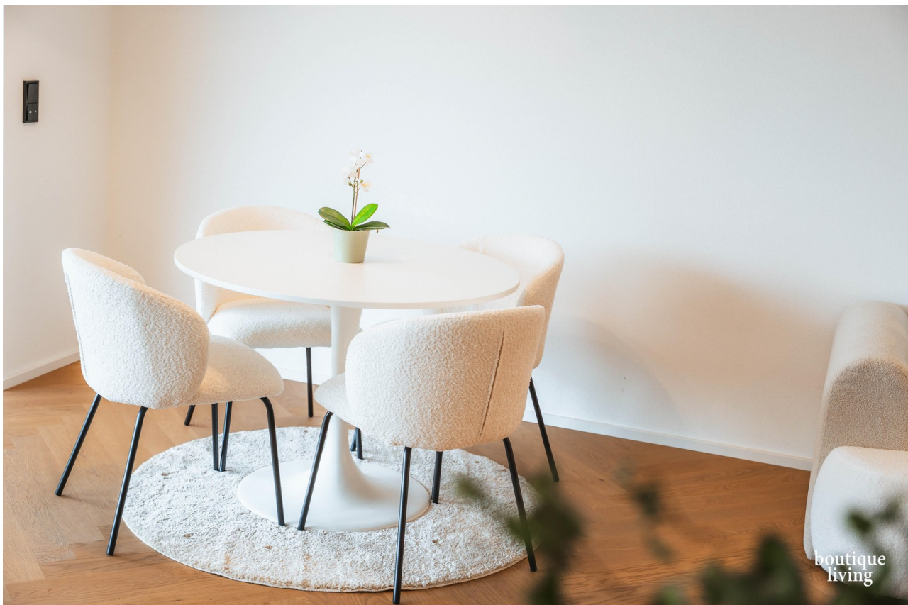
BOUTIQUE LIVING - Beispielbild