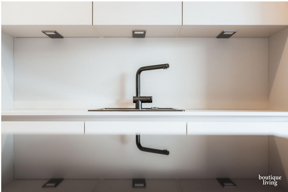
BOUTIQUE LIVING - Beispielbild