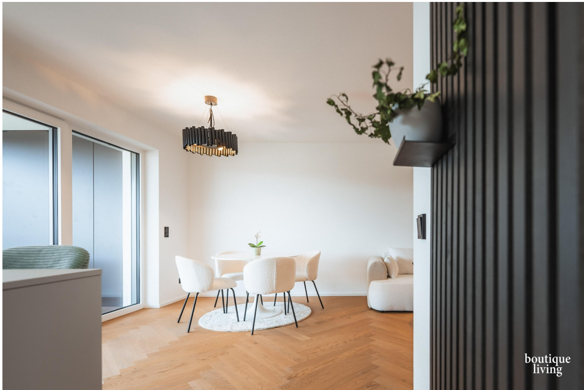
BOUTIQUE LIVING - Beispielbild