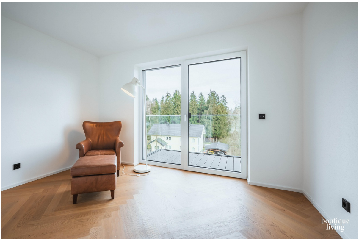
BOUTIQUE LIVING - Beispielbild