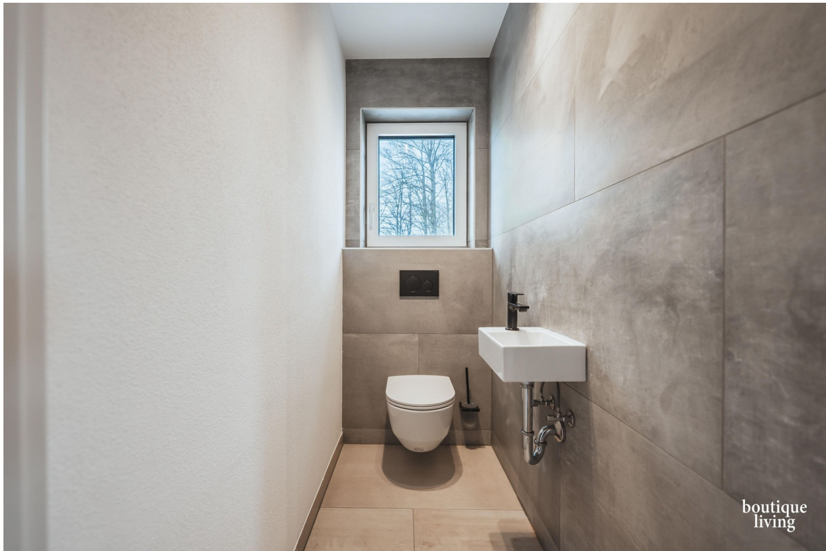
BOUTIQUE LIVING - Beispielbild