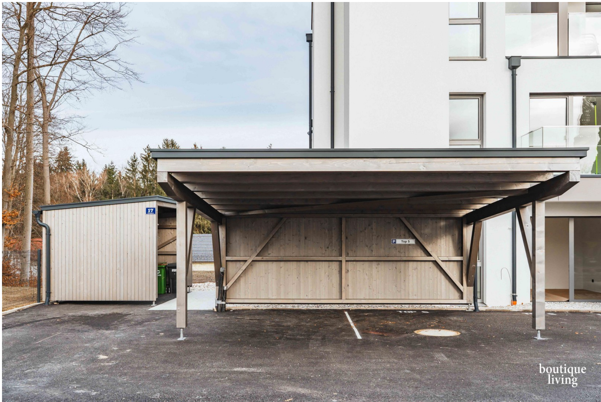
BOUTIQUE LIVING - Beispielbild