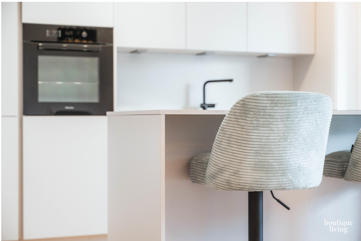
BOUTIQUE LIVING - Beispielbild