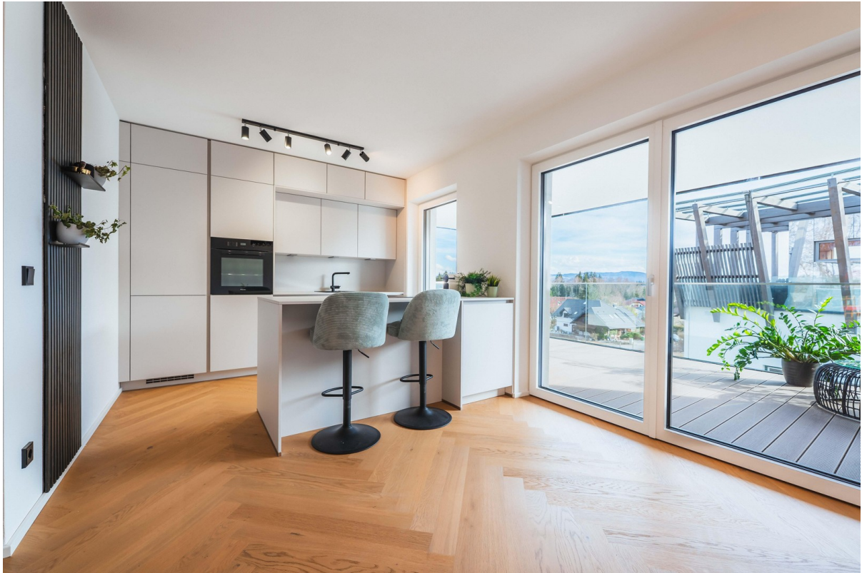
BOUTIQUE LIVING - Beispielbild