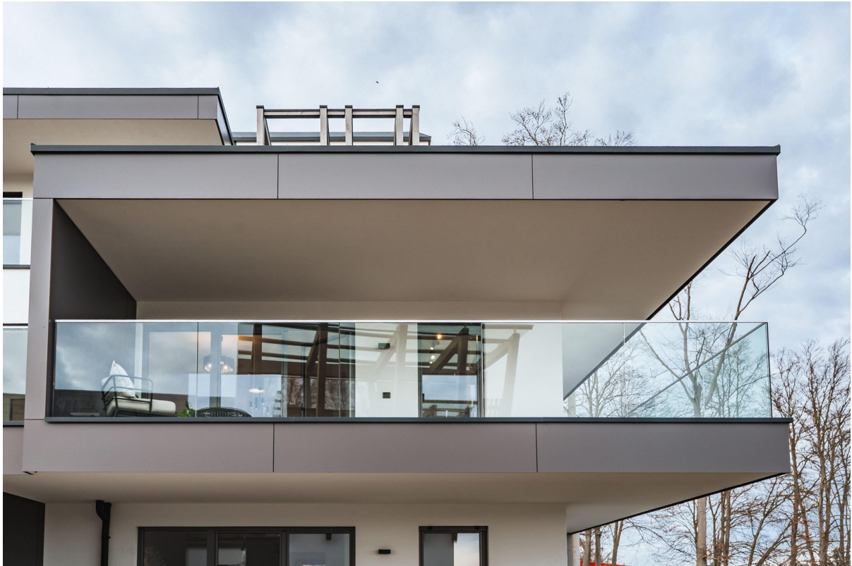
BOUTIQUE LIVING - Beispielbild