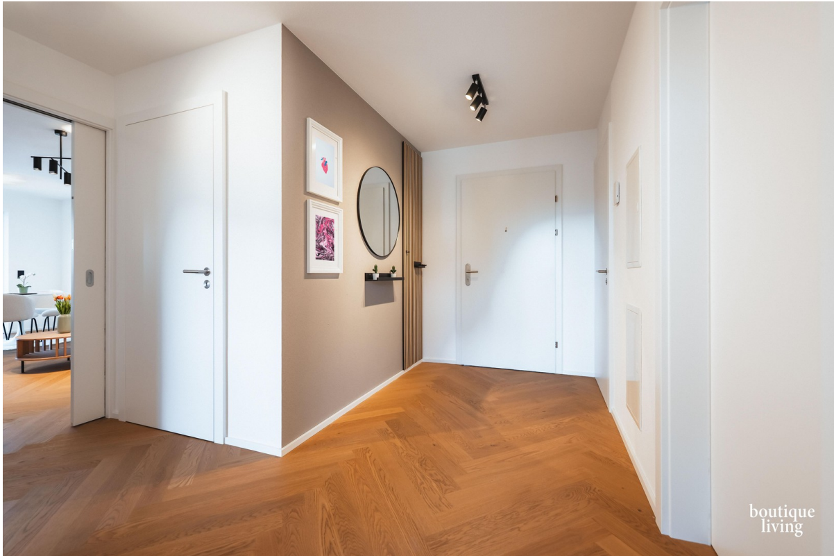
BOUTIQUE LIVING - Beispielbild