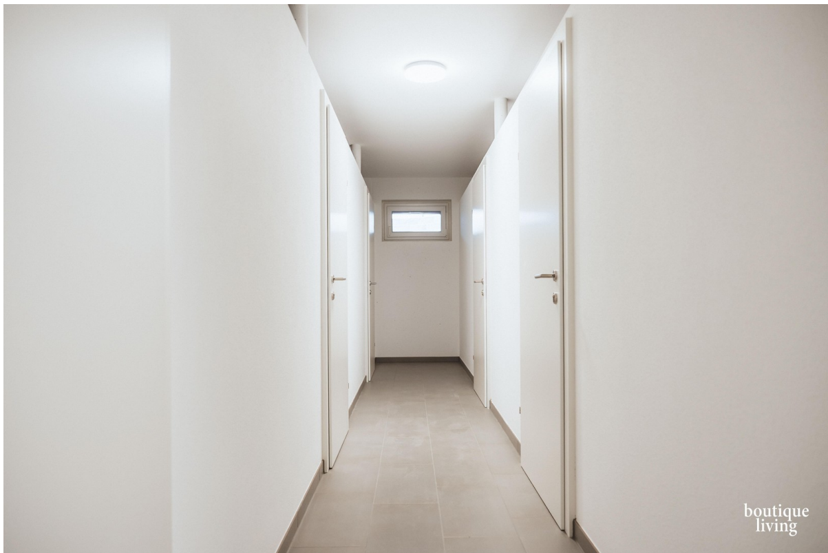
BOUTIQUE LIVING - Beispielbild