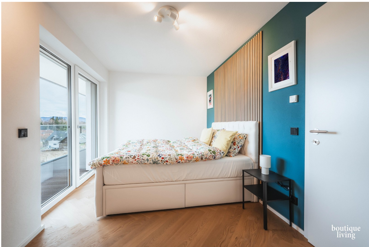
BOUTIQUE LIVING - Beispielbild