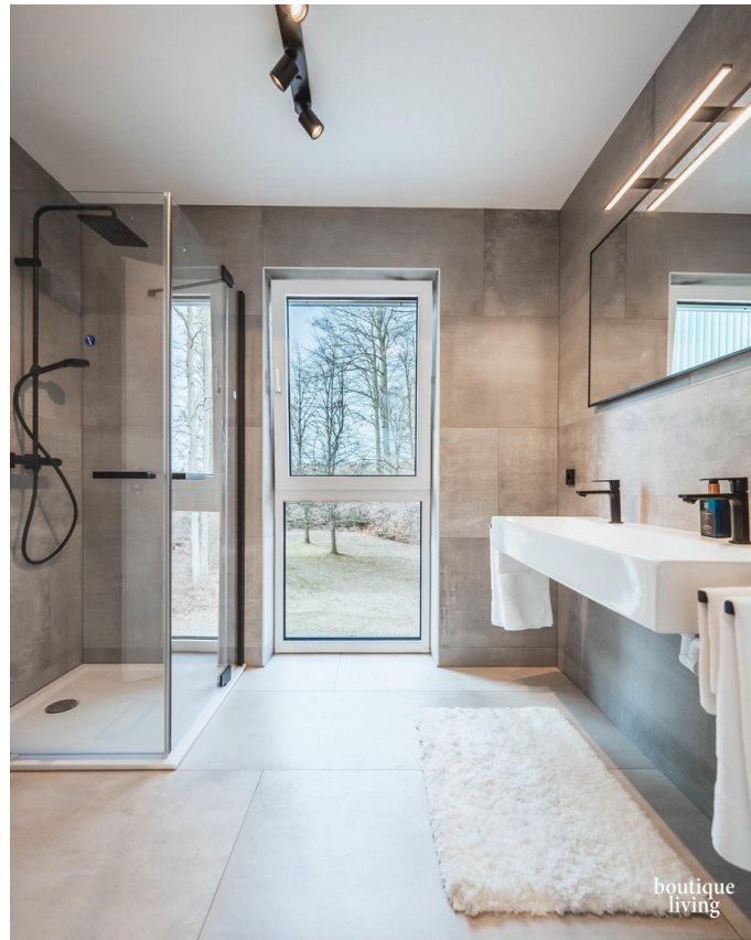
BOUTIQUE LIVING - Beispielbild