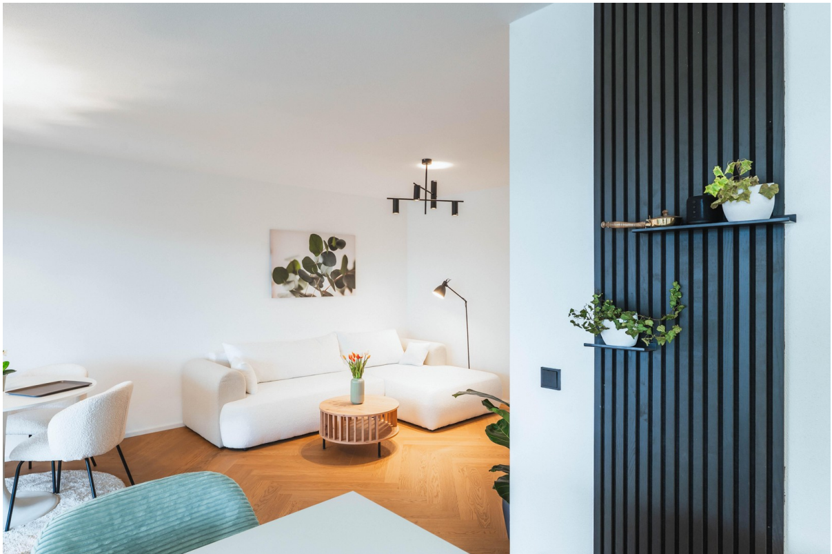
BOUTIQUE LIVING - Beispielbild