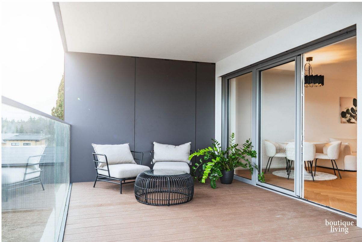
BOUTIQUE LIVING - Beispielbild