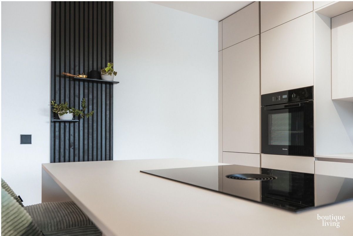
BOUTIQUE LIVING - Beispielbild