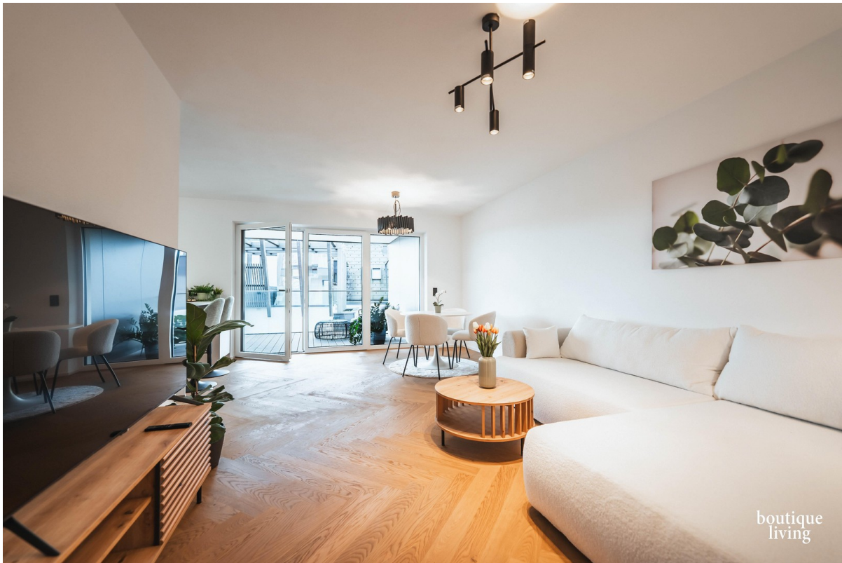
BOUTIQUE LIVING - Beispielbild