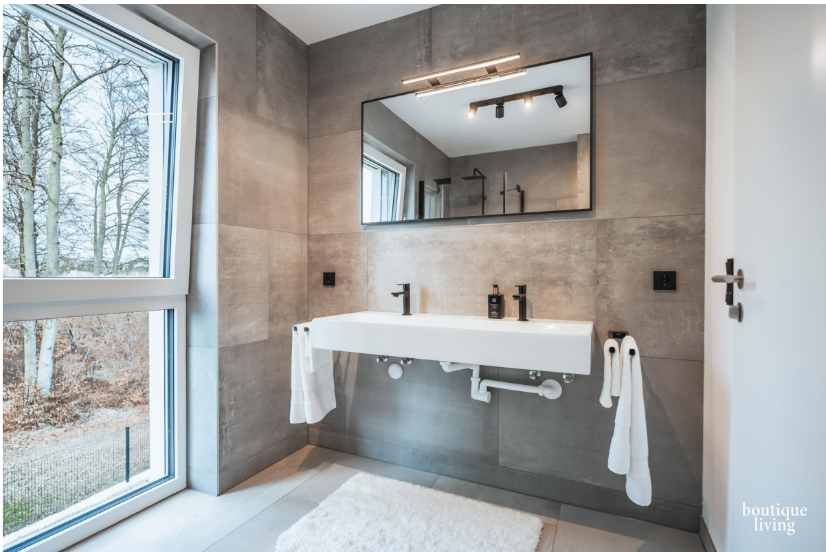
BOUTIQUE LIVING - Beispielbild