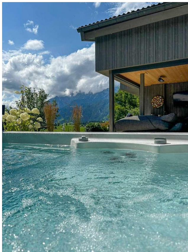
Pool am Chalet Leogang