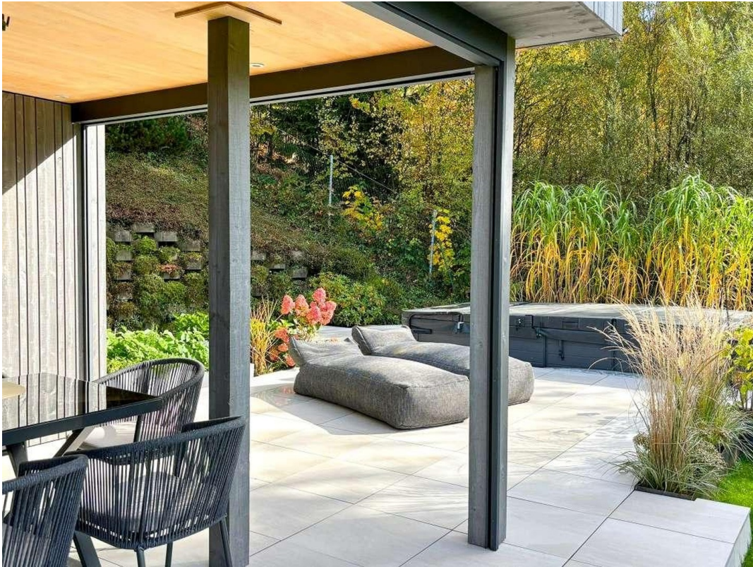
Relaxen am Pool