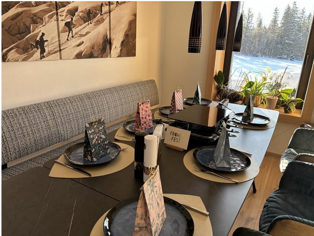
Esstisch - Chalet Bachwinkl