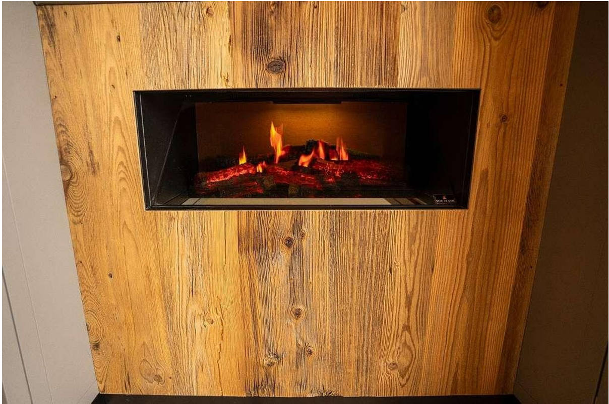
Kamin im Schlafzimmer