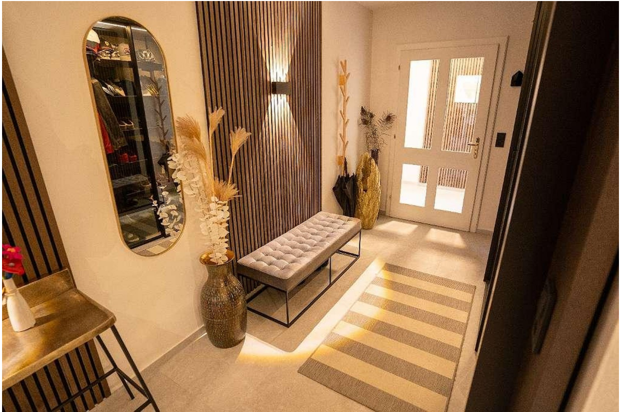
Flur - Stiegenhaus - Chalet