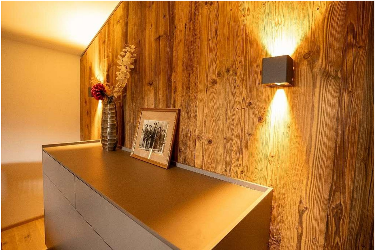
Schlafzimmer - Ankleide