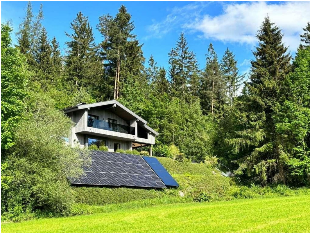
Chalet - Einfamilienhaus