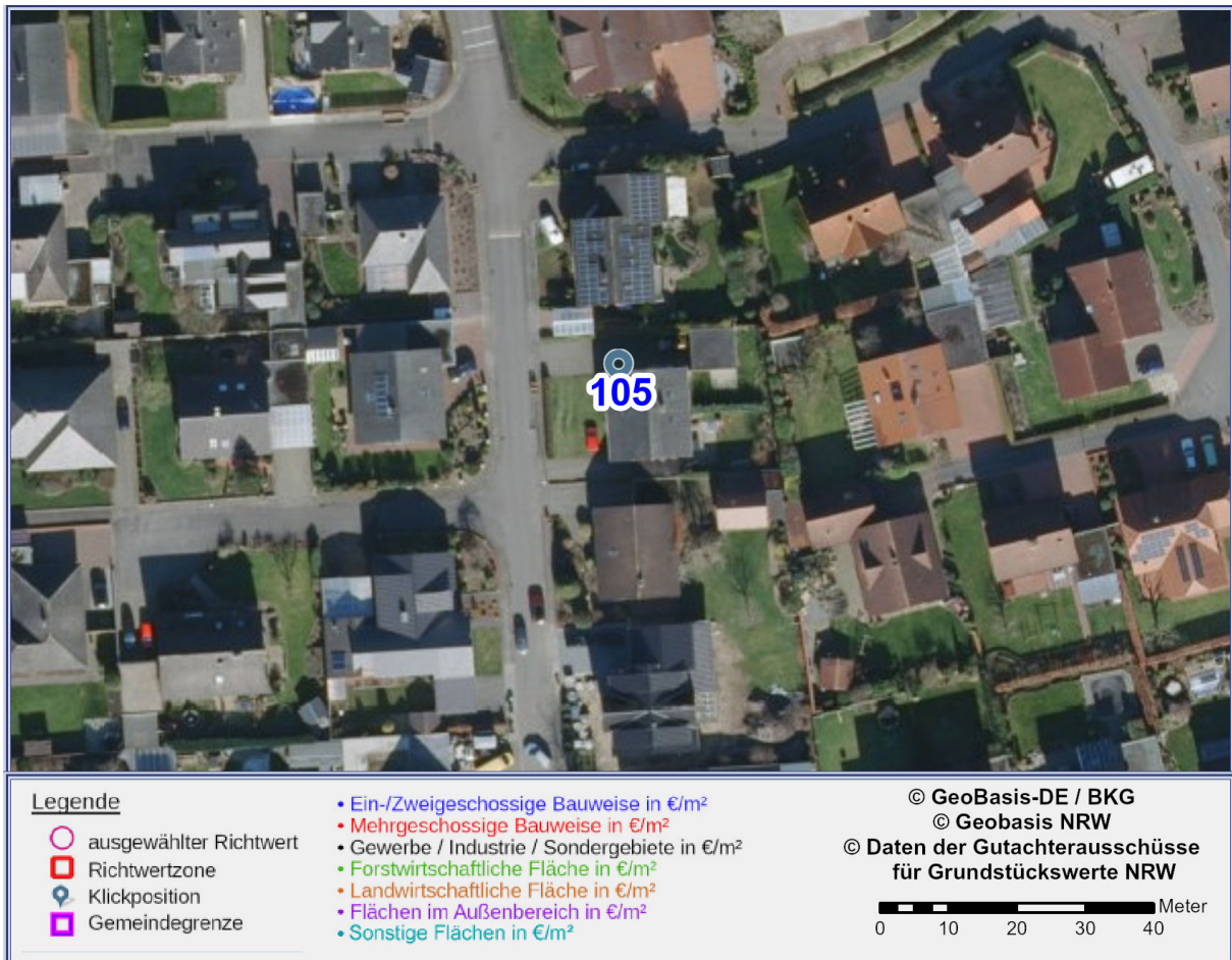
Abbildung 2: Detailkarte gemäß gewählter Ansicht