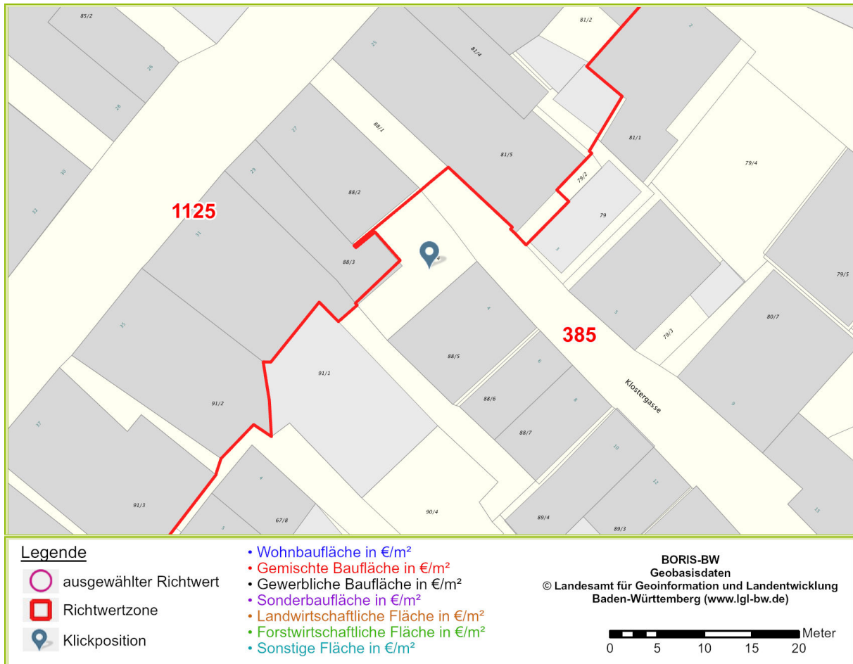
Abbildung 2: zentralisierte Darstellung der Klickposition mit den gewählten Einstellungen von Maßstab und Hintergrundkarte am Bildschirm

Der von Ihnen gewählte Bereich liegt in der Gemeinde/Stadt Rottenburg am Neckar. Die Darstellung dieses Kartenbereichs kann durch den Anwender individuell beeinflusst werden, z.B. durch Ändern der Klickposition, des Zoommaßstabs oder der Auswahl der Hintergrundkarte.