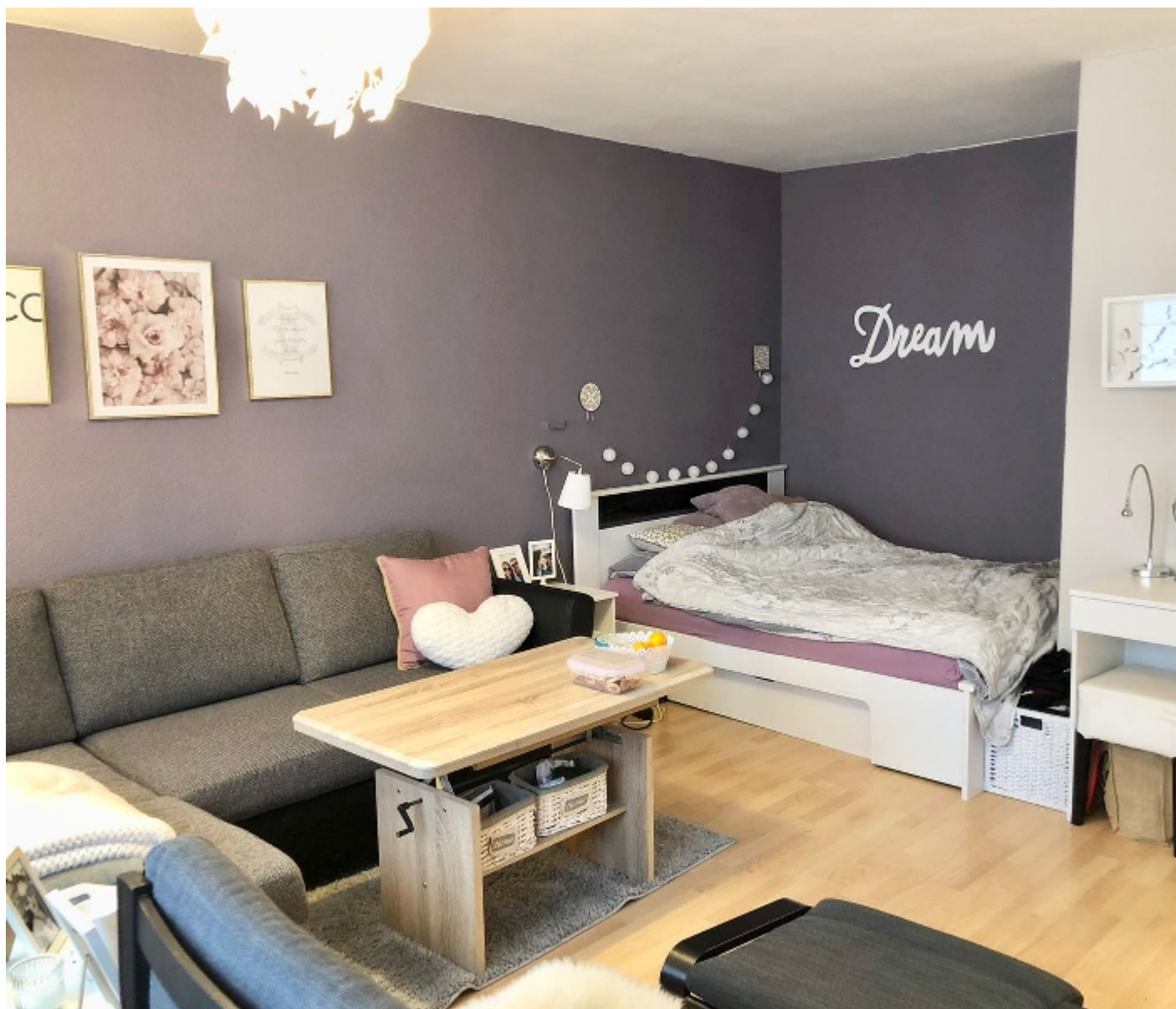
Wohnzimmer, Farb- und Einrichtungsmöglichkeit